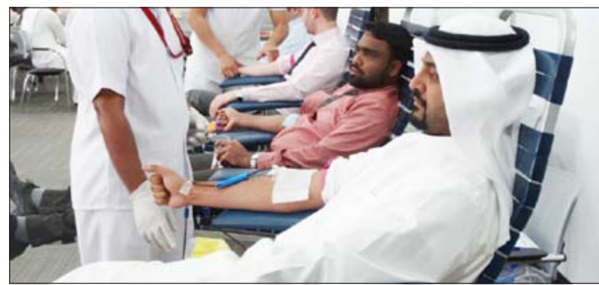
موظفو KPMG يتبرعون بالدم

بعضنا البعض والوقوف إلى جانب المحتاجين والمرضى، سواء بالتبرعات المادية أو عبر الأنشطة التفاعلية ذات القيمة المجتمعية المضافة. وأكدت KPMG استعدادها الدائم للتعاون مع بنك الدم المركزي الكويتي وكافة المؤسسات الاجتماعية الفاعلة وتقدمت بالشكر والتقدير من المسؤولين على بنك الدم، مشيدة بجهودهم في إنقاذ حياة الكثير من الناس من خلال توفير مخزون كبير من الدم للحالات الطبية الطارئة. وتميزت حملة KPMG بأقبال واسع من قبل موظفيها الذين توافدوا ليتبرعوا بالدم ويكفونوا ضمن الأشخاص الفاعلين على المستوى الاجتماعي والإنساني.