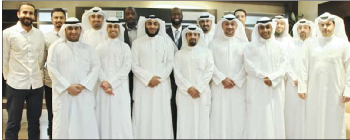
لقطة جماعية للمتدربين

نظم بيت التمويل الكويتي (بيتك) دورة تدريبية لمجموعة من موظفيه عن مهارات بناء فريق العمل والقواعد الأساسية في تكوين الشخصية القيادية القادرة على إدارة فريق عمل بطريقة سهلة وعصرية، وذلك في إطار نهج «بيتك» برفع كفاءة موظفيه وتزويدهم بكل مقومات النجاح بما يحقق الريادة للبنك. واستهدفت الدورة التي استمرت 3 أيام إلى تعزيز مهارات بناء الفريق والمساهمة في إيجاد ركيزة أساسية لاستكمال عوامل نجاح المؤسسة، وكذلك معرفة العوامل المؤدية إلى عرقلة سير العمل وإيجاد الأساليب الفعالة للتعامل معها وتجذب آثارها. وتعددت الدورة قدرة الموظفين على استخدام بعض الأساليب والطرق التي يتم من خلالها اكتشاف وتطوير الإبداع في أعضاء فريق العمل