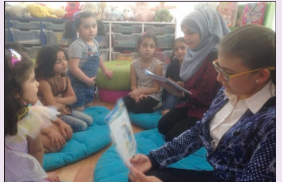
تقرأ قصصها للأطفال

● شكراً لك قاضتنا العزيزة. ● شكراً لكم وللحلق الأطفال.