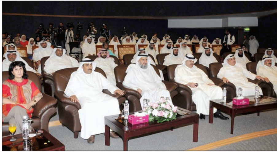
دبدر الزمانان في مقدمة الحضور

حيث تطور القانون من عقوبة الجرح بالغرامة والسجن 6 أشهر أو بإحدى هاتين العقوبتين إلى السجن 10 سنوات للجرائم الإلكترونية.