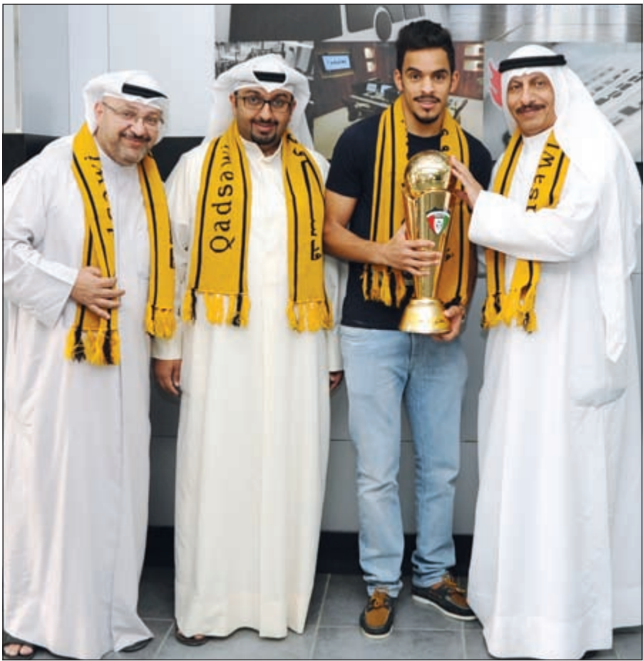
بديح وعجب والعوضي والرمضان مع كأس سمو الأمير