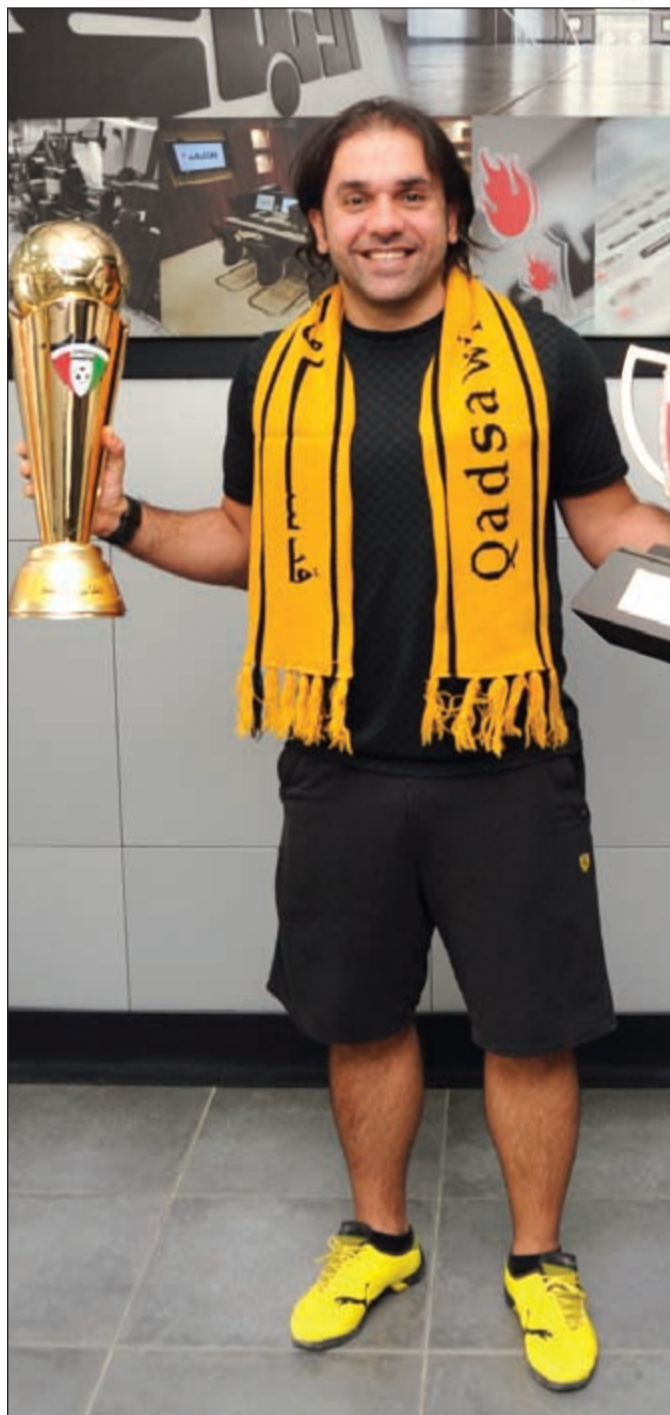
النكاس يحمل الكاسين معا