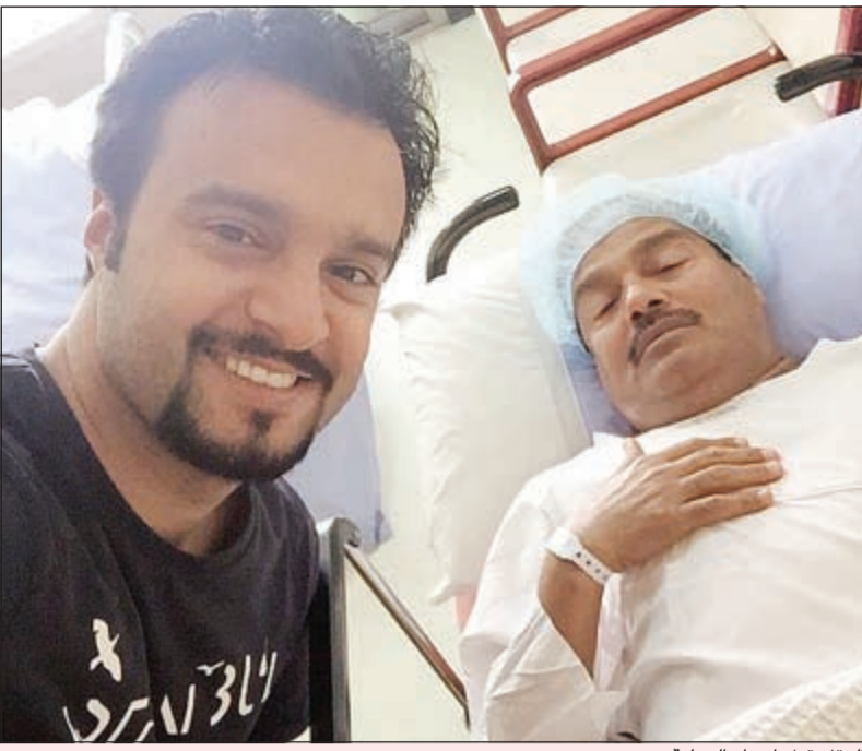
العقل قبل إجراء العملية