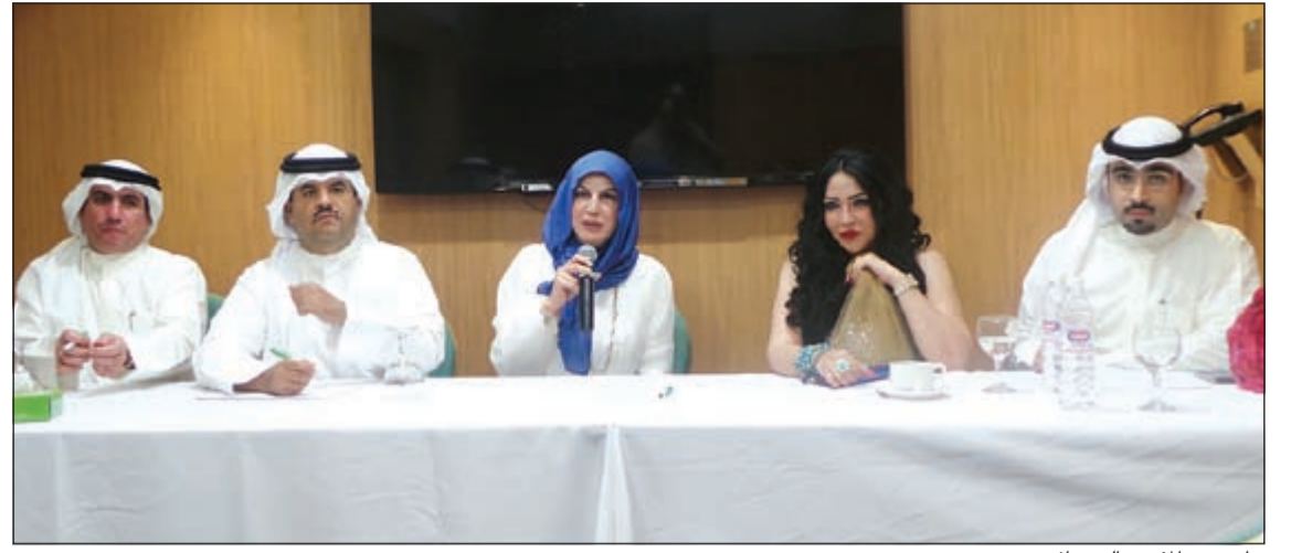
جانبا من المؤتمر الصحفي