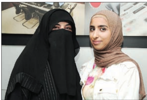
قيروان المولى مع والدتها