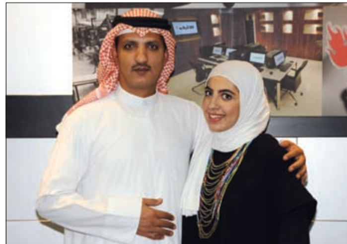
لقطة تنكارية بمناسبة التفوق