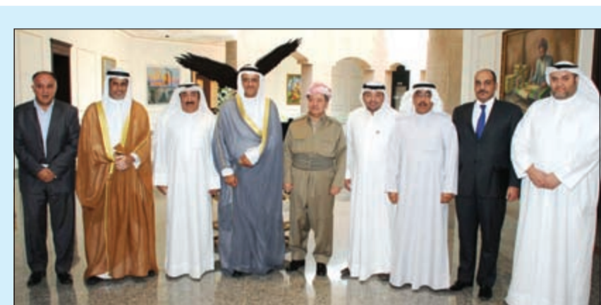
رئيس إقليم كردستان مسعود البارزاني مستقبلا رئيس التحرير الزميل يوسف خالد المرزوق وأعضاء الوفد الزلاء سعد العلي وعبدان البرادع وعبد الرحمن العليان بحضور قسما العام في أربيل عن الكندي رةته مساعد الكليب والقائم بأعمال سفارتنا في بغداد خالد قناني (ماني الشمري)

ثلاثة عناوين رئيسية خرج بها الاجتماع النيابي - الحكومي الذي عقد في مكتب المجلس أمس، وهي: رفع الجاهزية الأمنية إلى مستويات عالية وتماسك الجبهة الداخلية والحفاظ على لحةمة النسج الوطني وتعاون السلطتين التشريعية والتنفيذية. رئيس مجلس الأمة مرزوق الغائم قال في تصريح صحافي عقب الاجتماع الذي حضره أكثر من 30 نائبا و5 وزراء: إن النائب الأول لرئيس الوزراء وزير الخارجية الشيخ صباح الخالد قدم عرضا تفصيليا أبرز التطورات الإقليمية خلال الفترة الماضية بدءا من ملف مجلس