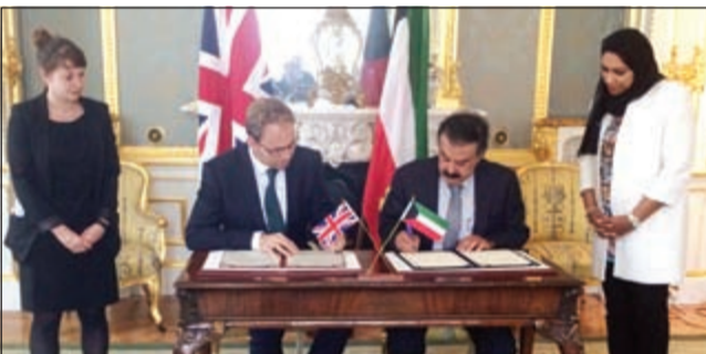
خالد الجارالله خلال توقيع خطة عمل لجنة التوجيه المشتركة مع وكيل وزارة الخارجية لشؤون الشرق الأوسط وشمال أفريقيا توبياس الورد

الكويت والمملكة المتحدة توقعان خطة عمل لجنة التوجيه المشتركة