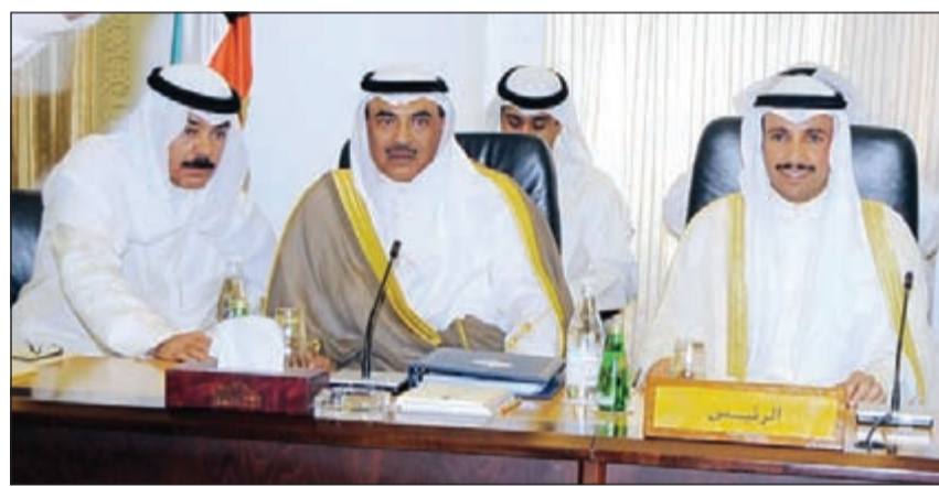
رئيس مجلس الأمة مرزوق الغائم والشيخ صباح الخالد والشيخ محمد الخالد خلال اجتماع السلطتين أمس

تضمنت الخطوط العريضة للتحرك الأمني خلال الأشهر الـ 6 المقبلة، وبين أنه وبعد العرض الحكومي قدم الأعضاء خلال الاجتماع ملاحظاتهم المختلفة ومدخلاتهم إزاء الموضوع، مشيرين إلى أن الأعضاء أعربوا عن شكرهم لرجال الأمن لما يقومون به من دور وطني في حفظ أمن البلاد، من جانبه، قال وزير الدولة لشؤون مجلس الوزراء الشيخ محمد العبدالله إن الحكومة أطلعت نواب مجلس الأمة على الاستعدادات الأمنية تحسبا لأي طارئ في البلاد، وقال العبدالله في تصريح صحافي إن الحكومة قدمت شرحا تفصيليا عن استعداداتها للتعامل مع أي طارئ خلال الأزمات الحالية، مشيرين إلى أن الاجتماع شهد تجانس الآراء بين الجانبين الحكومي والنيابي.