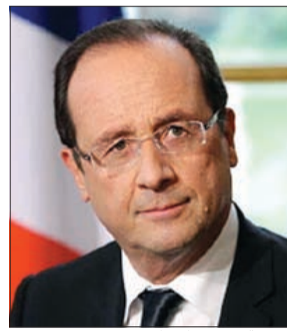
الرئيس الفرنسي فرانسوا هولاند

وذكرت «رويترز» أن الصفقة تتضمن 24 طائرة من صنع شركة «إيرباص» وأن العقد سوف يُوقع قريبا.