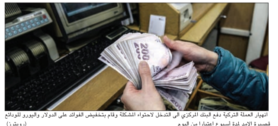
انهيار العملة التركية دفع البنك المركزي الى التدخل لاحتواء المشكلة وقام بتخفيض الفوائد على الدولار واليورو للودائع قصيرة الامد لمدة اسبوع اعتبارا من اليوم

الاستثمار بين السياسة والاقتصاد وقفز الدينار بحوالي 3٪ امس أمام الليرة مقارنة مع نهاية الاسبوع الماضي، في مسلسل من الارتفاع بلغ نحو 40٪ في عامين، ويعتبر هذا الانخفاض في سعر الليرة التركية مقابل الدينار فرصة جيدة لمن يريد الاستثمار خصوصا في العقار (السكن السياحي أو للاستثمار)، مع الأخذ بالاعتبار مستوى المخاطر السياسية التي قد ترتفع في حال لم يكن حزب اردوغان الحاكم مرنا اصنام التحولات السياسية القادمة في تركيا وفي المنطقة عموما. وتحديث اخبار سفير تركيا في الكويت عن استثمارات كويتية تقارب الملياري دولار في تركيا. ولكن يبدو ان الفرصة ستكون جيدة للتجار والمستوردين من تركيا، خصوصا ان السنوات الاخيرة شهدت ارتفاعا في