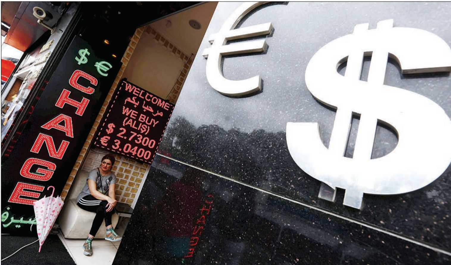
الدينار الكويتي يغفز بـ 73 أمام الليرة التركية في مسلسل من الارتفاع بلغ نحو 40٪ في عامين حيث يعتبر الانخفاض فرصة جيدة لمن يريد الاستثمار في العقار للسكن السياحي أو للاستثمار وفي الصورة امرأة تجلس في مكتب صرافة وسط العاصمة اسطنبول