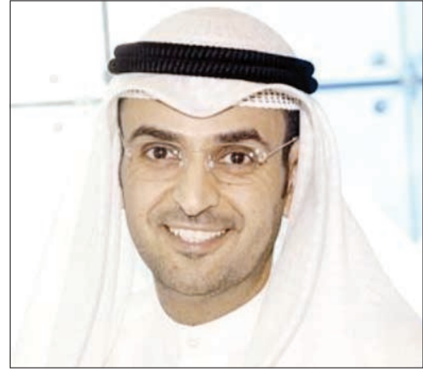
د. نايف الحجرف

وبخصوص ملف تطبيق قواعد الحوكمة على الشركات المدرجة بالبورصة الكويتية، والذي شهد شداً وجدياً في مرحلة سابقة وأرجى العمل به، قال الحجرف إن الهيئة أجرت تعديلات على هذه القواعد، وتم إرسالها للجهات المعنية بالتطبيق لأخذ ردها حتى منتصف الشهر الجاري، على أن تصدر الصيغة النهائية