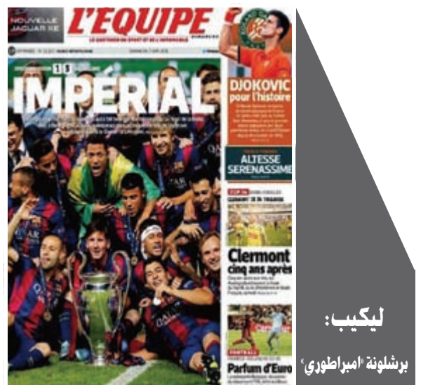
ليكيب: برشلونة إمبراطوري