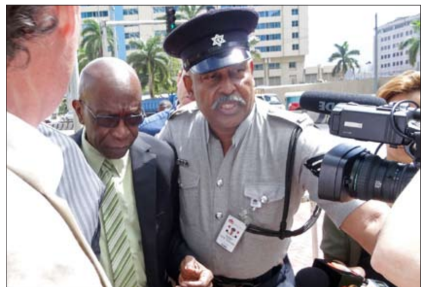
نائب رئيس الفيفا السابق جاك وارنر مقتادا مع رجل الشرطة

الكلام في وقتها لكان من الممكن أن يتعرض الاتحاد المصري لعقوبات من الفيفا، لأننا لم نسجل لأحد. من جهة أخرى كشفت «بي بي سي» ان وارنر استعمل الكونكاكاف لنيل استضافة مونديال 2010. وتكررت بي بي سي، هيئة الإذاعة البريطانية، مع تأكيد معلوماتها بوثائق مصرفية وصور على موقعها الالكتروني «ان نحو 1,6 مليون دولار استعملت لتسديد بطاقات الائتمان والقروض الشخصية للنائب السابق لرئيس الفيفا».