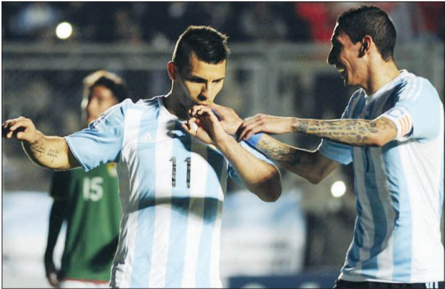
نجم الأرجنتين دي ماريا وأغويرو تناوبا على تسجيل الاهداف

افتتح دي ماريا التسجيل في الدقيقة 24 وبعد أربع دقائق فقط اضاف أغويرو الهدف الثاني من ضربة جزاء. وسجل أغويرو الهدف الثاني له والثالث للأرجنتين في الدقيقة 31 ثم أحرز الهدف الثالث له والرابع لبلاده في الدقيقة 50 قبل أن يختم دي ماريا التسجيل في الدقيقة 55 من ضربة جزاء. كما استعرضت الاوروغواي امام ضيفتها غواتيمالا واكتسحتها 5-1 وديا في مونتيفيديو. سجل للاوروغواي ديبغو فورلان (3) وادينسون كافاني (19) و32 من ركلة جزاء) وجيورغان دي اراسكايانا (55) وابسل هرنانديز (56)، ولغواتيمالا ولسون لالين (78). وفازت كولومبيا على كوستاريكا 0-1 في بوغوتا، وجاء الهدف من توقيع راداميل فالكاو في الدقيقة 47. وفازت الاكوادور على بنما 4-0. وسجل الاهداف بولانوس (27) ومارتينيز (32) و41) ومونتيرو (53).