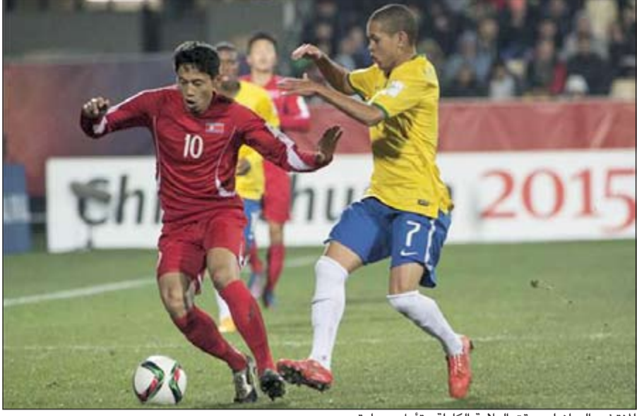
المنتخب البرازيلي حقق العلامة الكاملة وتأهل بجدارة