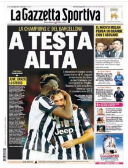
لاغازيتا: تيفي مرفوعة