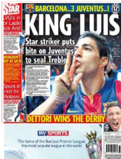
الدبلي ستار: الملك سواريز