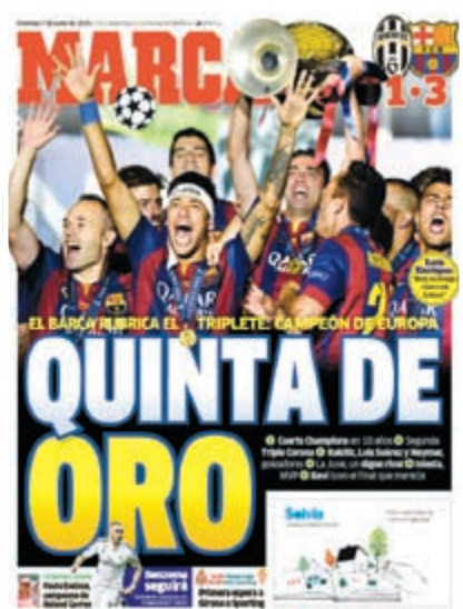
ماركا: ثلثية ثانية لبرشلونة ونجمة خامسة