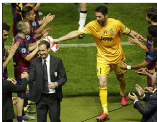
عملاق يا بوفون (أ.ب)

بات نجم برشلونة وقائده اندريس انيسستا ثاني لاعب فقط يحرز لقب مسابقة دوري الأبطال منذ انطلاقتها بصيغتها الجديدة (عام 1992) أربع مرات بعد الهولندي كلارينس سيدورف الذي يبقى اللاعب الوحيد الذي احسز اللقب مع ثلاثة فرق مختلفة بعد ان توج مع اياكس (1995) وريال مدريد (1998) ضد يوفنتوس بالذات) وميلان (2003 و 2007). وقال الرسام عقب الفوز بدوري الأبطال للمرة الخامسة في تاريخ النادي وتحقيقه للثلاثية هذا الموسم: «بعد مرور زمن سيتم تقدير ما حققناه أكثر، أهم شيء الآن هو أن نستمتع جميعاً ولاقصى درجة، لأن تحقيق هذا الأمر لم يكن هيناً». وتابع: «اللعب في هذا الفريق يعد مصدرنا للفخر، لا توجد كلمات لتوصف ما حققناه، كان تحقيق الثلاثية يبدو أمراً صعباً، ولكننا عدنا لفعل هذا الأمر مجدداً».