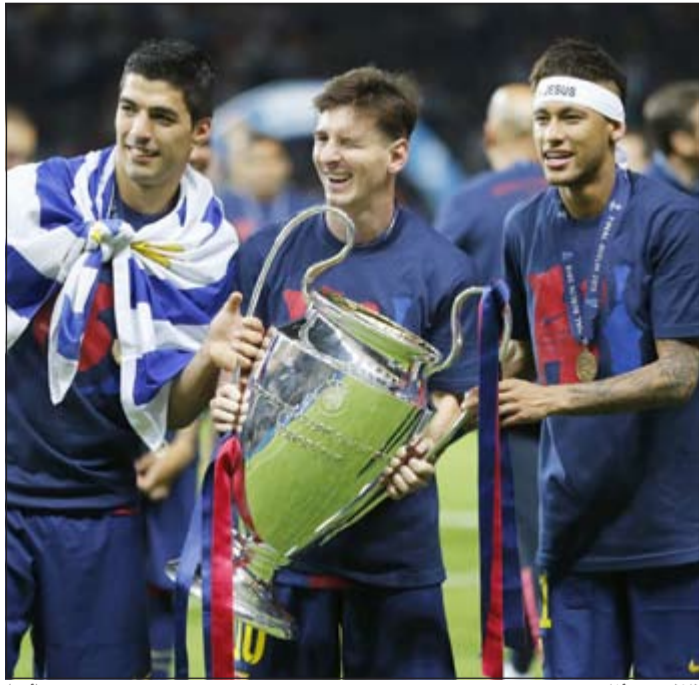
ثلاثي من الماس

عزز الثلاثي الهجومي المربع لفريق برشلونة المكون من الساحر الأرجنتيني ليونيل ميسي والنجم البرازيلي نيمار دا سيلفا والهداف الأوروغوياني لويس سواريز رقمه القياسي التهديفي خلال موسم واحد، بعدما سجل 122 هدفاً في مختلف البطولات هذا الموسم. وواصل الثلاثي ممارسة هوايته في هز الشباك بعدما سجل سواريز ونيمار هدفين خلال فوز الفريق الكatalوني 3-1 على يوفنتوس، بطل الدوري الإيطالي في المباراة النهائية لبطولة دوري أبطال أوروبا. وتفوق ثلاثي النادي الكatalوني بهذين الهدفين بفارق أربعة أهداف على الرقم القياسي السابق المسجل باسم ثلاثي الغريم التقليدي ريال مدريد المكون من كريستيانو رونالدو وكريم بنزيمة وغونزالو هيغواين عام 2012.