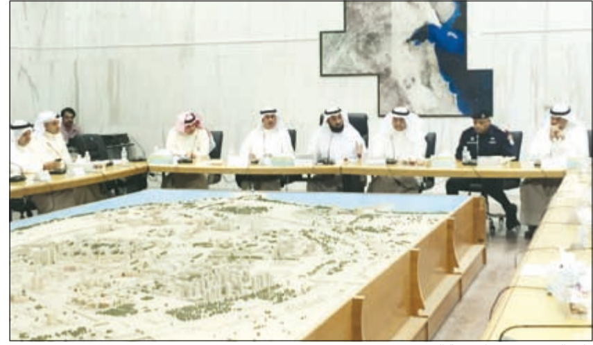
مناخ العجمي مترشسا ورشة العمل

انتهت ورشة العمل الخاصة المتعلقة ببحث الخدمات في محافظة مبارك الكبير والتي نظمتها اللجنة أمس إلى ضرورة الاستفادة من موقع ردم النفايات واستغلال مواقع حكومية خاصة أن مساحة الموقع تصل إلى مليون متر مربع.