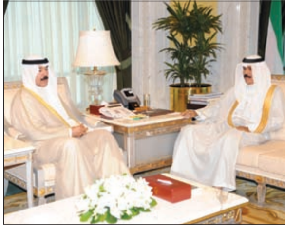
سمو ولي العهد الشيخ نواف الأحمد خلال استقباله الشيخ محمد الخالد

كما استقبل سمو ولي العهد الشيخ نواف الأحمد بقصر السيف ظهر أمس رئيس مجلس الوزراء ووزير الدفاع الشيخ خالد الجراح.