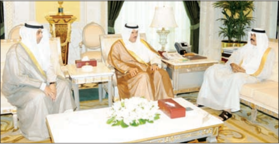
سمو ولي العهد الشيخ نواف الأحمد مستقبلاً الشيخ سلمان الحمود والشيخ محمد العبدالله