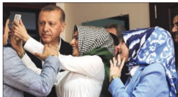
مسؤولة في إحدى اللجان الانتخابية تلتقط «سيلفي» مع الرئيس رجب طيب أردوغان بعد الإدلاء بصوته

الأتران يختارون برلمانهم الجديد.. والأكراد من أهم اللاعبين الجدد