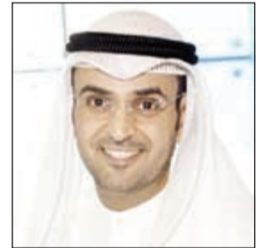
د. نايف الحجرف

الحجرف: اللامحة التنفيذية لتعديلات قانون هيئة أسواق المال 10 نوفمبر 31