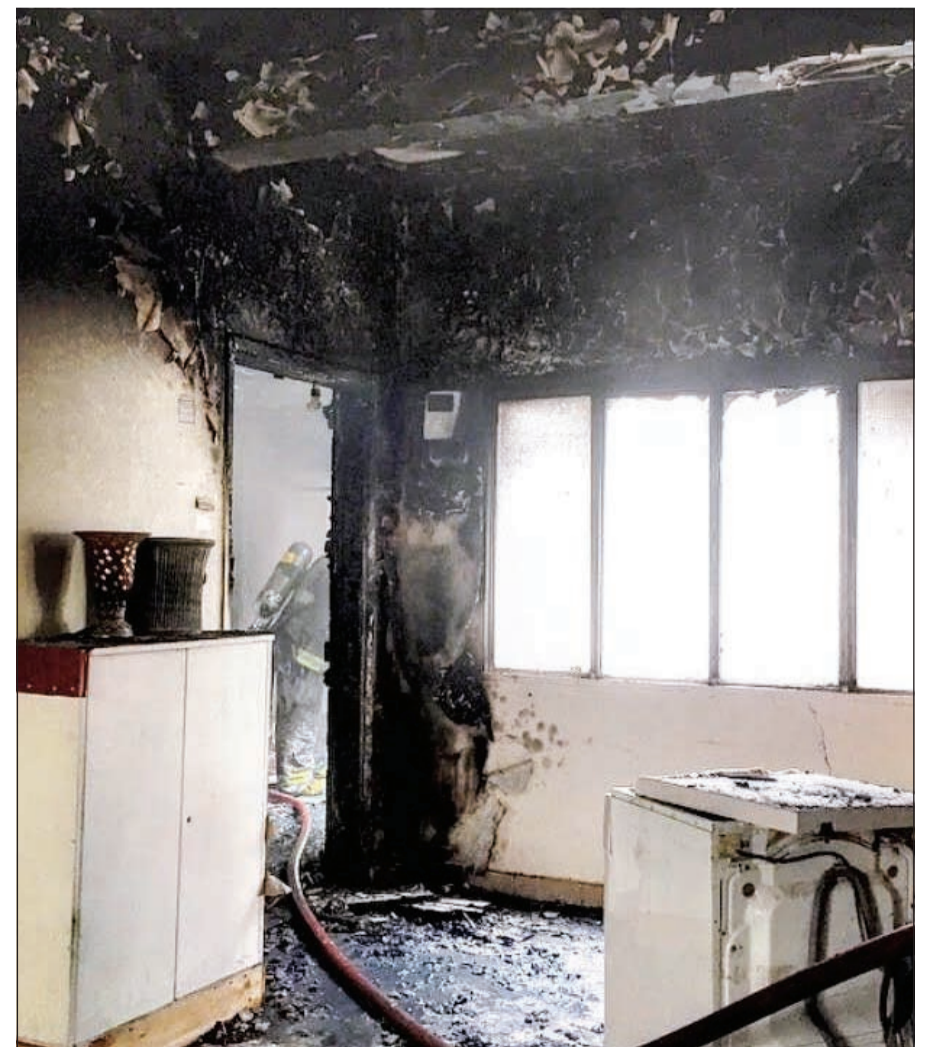
الحريق أحدث تلفيات بالغة في صالة المنزل