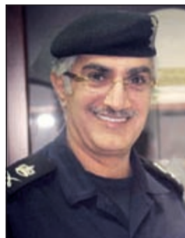
اللواء إبراهيم الطراح

لأن القبض عليه سيحدث أجلا أو عاجلا، بالطبيب أو بغير الطبيب. حديث مدير عام مديرية أمن محافظة العاصمة اللواء إبراهيم الطراح كان مقتعا بالنسبة لمواطن مسلح ومن أرباب السوابق، حيث تقدم من تلقاء نفسه بعد أن ألقى سلاحه الناري جانبا ليسلم نفسه إلى مدير الأمن. وبحسب مصدر أمني،