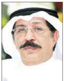
اللواء عبدالحميد العوضي