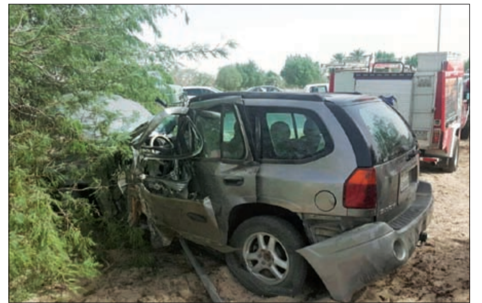
المركبة بعد الحادث