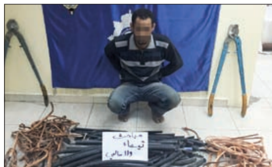
أحد اللصوص بعد ضبطه في الجهراء