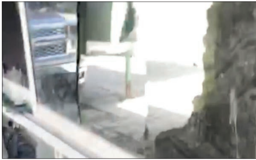
التلفيات التي أحدثها المتهم في منزل عائلته

المتهم بتسليم نفسه والسلاح. وتبين أن خلافات عائلية وراء الواقعة، وأن المسلح وحارق ديوانية أسرته من أرباب السوابق في قضايا المخدرات. يذكر أن المشاورات بين المسلح ومدير الأمن استمرت لنحو ساعتين حتى اقتنع.