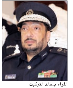
اللواء م. خالد التركيت

أعلن نائب المدير العام لشؤون قطاع تنمية الموارد البشرية اللواء م. خالد يوسف التركيت عن بدء المقابلات الشخصية لمن أنهى الاختبارات اللازمة من حملة الشهادات