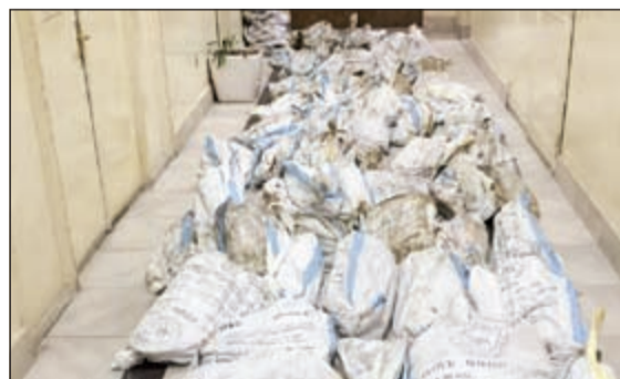
المخزن المستاجر وبداخله المسروقات من النحاس