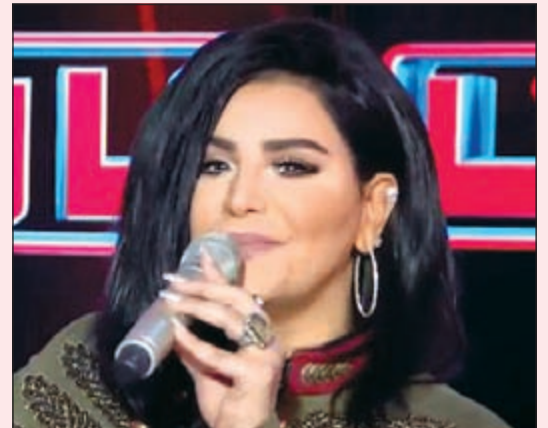
فنانة العرب في «تاراتاتا»