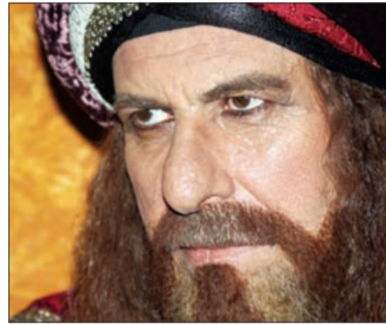
شخصيته في مسلسل «القعقاع»