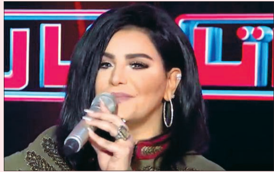
فنانة العرب في «تاراتاتا»