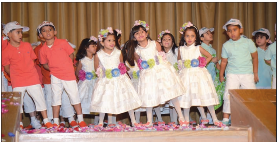
أحدى فقرات الحفل

نظمت شركة المشروعات السياحية مسابقة للسباحة بمختلف أنواعها مع أكاديمية كميردج للسباحة «المنقذ»، حيث شارك فيها أكثر من 50 متسابقاً من الجنسين