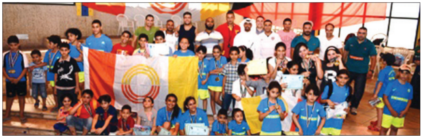
اللجنة المنظمة مع الفريقين في ختام المسابقة

تراوحت أعمارهم بين 6 سنوات و 15 سنة. وأقيمت المسابقة في مجمع أحواض السباحة أحد مرافق شركة المشروعات السياحية، وقد بدأت المسابقات في مختلف أنواع السباحة بين الفريقين من الجنسين حسب الفئات العمرية لكل متسابق منها 25م حرة، 25م ظهر، تتابع 25×4 م. وفي الختام، قامت اللجنة