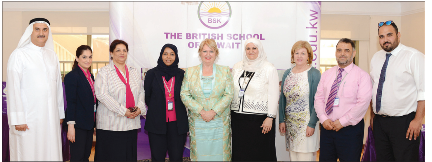
لقطة تذكارية خلال الحفل