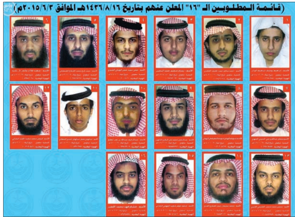
قائمة المطلوبين الـ 16 المعلن عنهم أمس (واس)

وتابع: «وزارة الداخلية إذ تعلن ذلك لتؤكد أن الجهات الأمنية ستواصل جهودها في ملاحقة وتعقب كل من له صلة بهذا العمل الإجرامي ممن سلموا عقولهم لشعارات وإملاءات جهات لا تريد الخير بالوطن والمواطن وتسعى إلى نقض عرى الأخوة والقربى التي سادت مجتمعنا منذ عهد المؤسس المغفور له بإذن الله الملك عبدالعزيز، رحمه الله، وإن ما أظهره المجتمع السعودي بكافة فئاته وتوحد صفه تجاه هذا الإرهاب المقيت لهو خير رد على أدوات الفتنة ومخرب وراهب، ومن جهة أخرى فإن التحقيقات في هذه الحوادث الإرهابية تحرز تقدما ملموسا بفضل الله وتم ضبط العديد من الأطراف ذات العلاقة بتلك الحوادث، والله الهادي إلى سواء السبيل...» وفي بيان ثان منفصل، صرح المتحدث الأمني لوزارة الداخلية بأنه «إحاطا لما سبق إعلانه، يوم الأحد الموافق 1436 / 8 / 16 هـ عن العمل الإجرامي الذي استهدف المصلين في مسجد الإمام علي بن أبي طالب عليه السلام ببلدة القديح وعلاقة منفعه بخلفية إرهابية كشفت التحقيقات عن مشاركة خمسة من عناصرها في إطلاق النار على إحدى دوريات أمن المنشآت أثناء أدائها مهامها واستشهاد قائدها، والبيان الصادر يوم الجمعة بتاريخ 1436 / 8 / 11 هـ عن إحباط العمل الإرهابي الذي كان يستهدف المصلين بمسجد الحسين عليه السلام في حي العنود بالدمام وأقدام الجاني