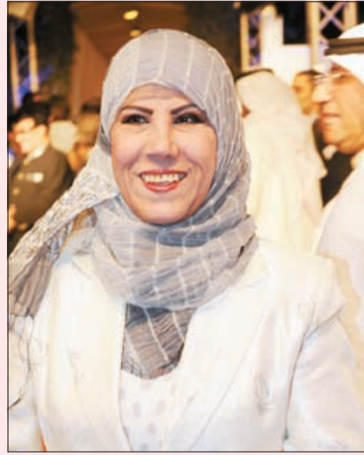
الفنانة القديرة مريم الصالح

أعربت الفنانة القديرة مريم الصالح عن بالغ سعادتها بالعودة إلى العمل الفني من جديد بعد فترة انقطاع ليست بالقصيرة، حيث انضمت مؤخراً إلى طاقم عمل المسلسل الإذاعي الرمضاني «أثنين اخوان». وأكدت الصالح خلال حديثها لـ «الأنباء» أنها باشرت تسجيل حلقات المسلسل في استديوهات إذاعة الكويت بمشاركة كم كبير من النجوم موضحة أن العمل شكل عودتها للمسلسلات الإذاعية بعد فترة انقطاع جاءت بسبب مرضها وخضوعها للعلاج في الولايات المتحدة الأميركية بعد عودتها للكويت. وأفادت النجمة القديرة بأنها مستمرة في تسجيل حلقات المسلسل ليتم عرضه في شهر رمضان المبارك وأن ينال العمل إعجاب المستمعين في الكويت، خصوصاً أن المسلسل يضم كوكبة من نجوم الساحة الفنية الكويتية. الجدير بالذكر أن مسلسل «أثنين اخوان» مسلسل إذاعي كوميدي من تأليف أسماء اليحيوي وإخراج يوسف الخشاش ويشترك في بطولته خلاف مريم الصالح كم كبير من النجوم على رأسهم القدير سعد الفرج وإبراهيم الصلال وجاسم النبهان وإبراهيم الحربي وغيرهم من النجوم.