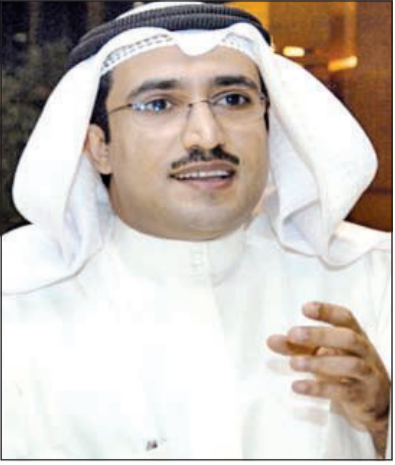
عميد المسرح د. فهد الهاجري

صرح د. فهد منصور الهاجري عميد المعهد العالي للفنون المسرحية د. فهد منصور الهاجري بأن حفل تخريج دفعتي 2013/2014 و 2014/2015 من خريجي المعهد بأقسامه الثلاثة، سيقام في تمام الساعة الثامنة من مساء يوم الأحد الموافق 7/6/2015 في فندق كراون بلازا - قاعة الأندلس تحت رعاية وزير التربية ووزير التعليم العالي د. بدر حمد العيسى.