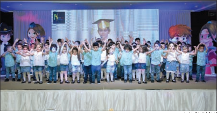
لقطة للأطفال المتخرجين