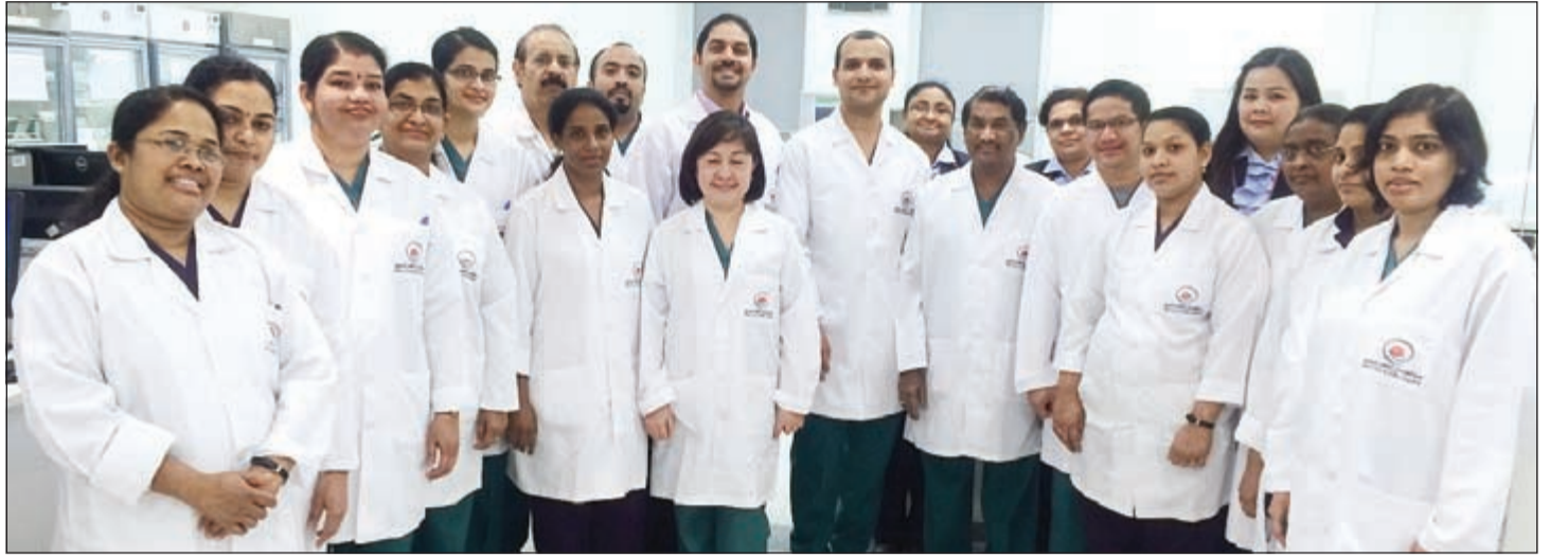
فريق العمل في لقطة تذكارية

ولم يخف انهار الضيوف بالعلامة التجارية وبتصاميمها العصرية الفعنة بالأنوثة، إلى جانب تنوع قطعها التي