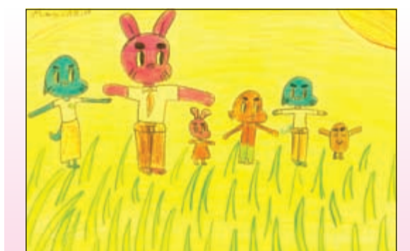
أحدى لوحات نورهان حسام