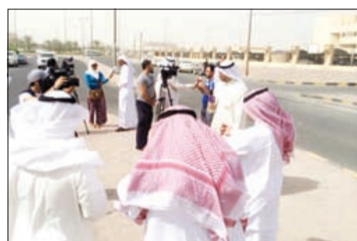
عدد من الأهالي خلال الوقفة الاحتجاجية