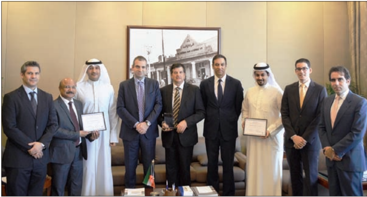
وقد «دويتشه بنك» يسلم البنك الوطني الجائزة

الوطني بأعلى تصنيف ائتماني بإجماع وكالات التصنيف العالمية «فيتش» و«موديز» و«ستاندرد آند بورز». كما يحتفظ بنك الكويت الوطني بموقعه بين أكثر 50 بنكا أمانا في العالم للمرة التاسعة على التوالي. ولدى مجموعة بنك الكويت الوطني أوسع شبكة فروع محلية ودولية حول العالم تغطي أهم عواصم المال والأعمال الإقليمية والعالمية مثل: لندن ونيويورك وباريس وجنيف وستغافورة إلى جانب البحرين ولبنان والأردن والسعودية والإمارات والعراق وتركيا والصين. وتوفر هذه الشبكة العملاقة مجموعة واسعة من الخدمات المصرفية والحلول الاستثمارية والتمويلية.