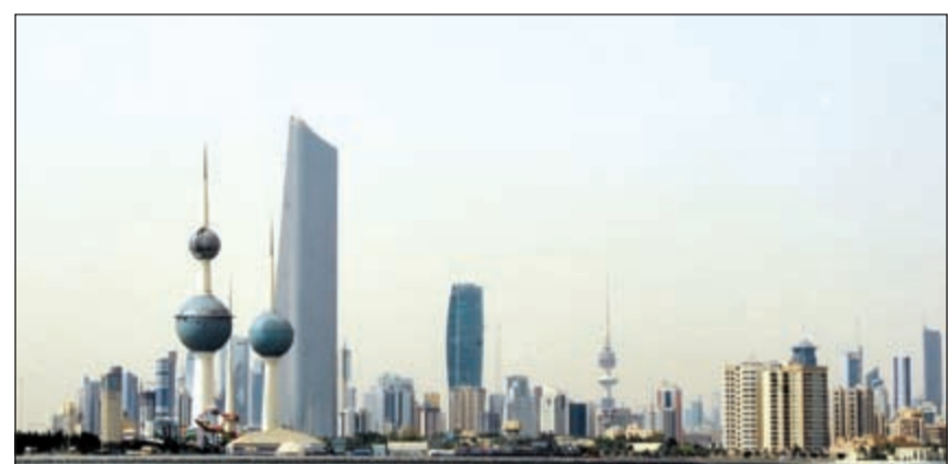
الكويت تتفوق على دول الخليج وبقية دول العالم في الدخل والتعليم والتوظيف رغم تراجعها في الصحة والبنية التحتية والحكومة والبيئة وذلك حسب دراسة لمجموعة بوسطن كونسلتينج

التي تغطي 10 محاور رئيسية، أو مجالات، تتضمن الاستقرار الاقتصادي، والصحة، والحكومة، والبيئة. وفي المجمل، يعتمد التقييم حوالي 50,000 بيانات. ويحدد تقييم التطور الاقتصادي المستخدم نتائج الدول بطريقتين: كلمة الوضع الحالي للرفاهية- كمقدار التطور الراهن في مجال الرفاهية بين العامين 2006 و2013.