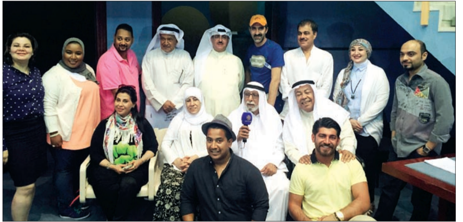
الشيخ فهد المبارك يتوسط نجوم المسلسل

جسد الوكيل المساعد لشؤون الإذاعة الشيخ فهد المبارك الصباح ترحيبه بنجوم الكويت الكبار خلال زيارته لهم أثناء تسجيل حلقات مسلسل «أثنين إخوان». مؤكداً إصراره على تقديم الدعم الكامل لإنجاز العمل على أكمل وجه لينضم إلى قائمة المسلسلات الإذاعية التي أنجزها قطاع الإذاعة لدورة شهر رمضان المقبل. وفي تصريح صحفي، قال الشيخ فهد المبارك إن الفنانين الكبار قدوة بالنسبة