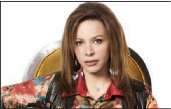
سوزان نجم الدين

تبدأ الفنانة السورية سوزان نجم الدين خلال الفترة القليلة المقبلة تسجيل أولى حلقات مسلسلها الإذاعي الجديد «الصبية والميجور» المقرر إذاعته عبر أثر الإذاعة المصرية، حيث سيحتفل فريق العمل ببداية تسجيل الحلقات داخل مبنى الإذاعة والتلفزيون بوسط القاهرة. ويشارك في المسلسل أحمد سلامة ومحبي إسماعيل، فيما كتب السيناريو أحمد القصبي ويخرجه هشام محب، علماً بأن تسجيل الحلقات سينتهي قبل بداية شهر رمضان وهو الموعد المحدد لعرض العمل، كما ستطلق الإذاعة حملة ترويجية له فور انطلاق تسجيله.