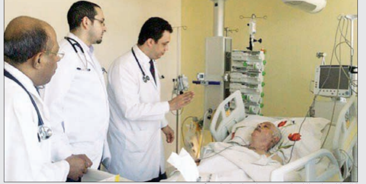
الطاقم الطبي يطمئن المطرب القدير حسين جاسم على حالته الصحية