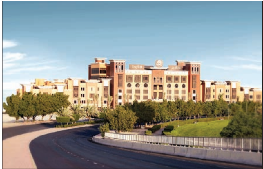
سفير الكويت - الفنتاس

فيمكنكم الاستمتاع في مطعم الروشنة الذي يقدم ألسّ الأطباق العربيّة الكوييتية الأصيلة ذات المذاق المميز في أجواء ساحرة وديكورات مبهرة على أنغام الموسيقى الشرقية التي تعكس التراث الكويتي بمزيج من الماضي والحاضر، حيث يعدّ المطعم الكوييتي الوحيد في فنادق الخمسة نجوم.