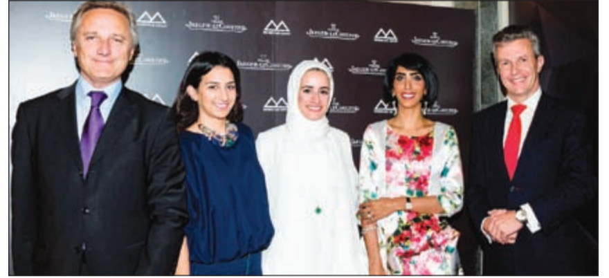
جيكر لوكولتر.. إضافة مميزة

لوكولتر بإبداع وتجسيد لترجمات رفيعة المستوى للتقويم الدائم في العديد من ساعاتهم. لقد أصبحت كل ساعة من هذه الساعات القطعة الحلم بالنسبة للذواقة وخبراء الحرف الفنيّة التواقين إلى الارتقاء إلى آفاق جديدة تطاول النجوم وعلاوة على الاستخدام والفائدة، فمن طبيعة وجوهر كل الوظائف التي توفرها جيكر- لوكولتر Jaeger-LeCoultre أن تقدم للشخص الذي يرتدي الساعة صورة أنيقة مصغرة تكون بمنزلة ترجمة للكون الذي يحيط بنا.