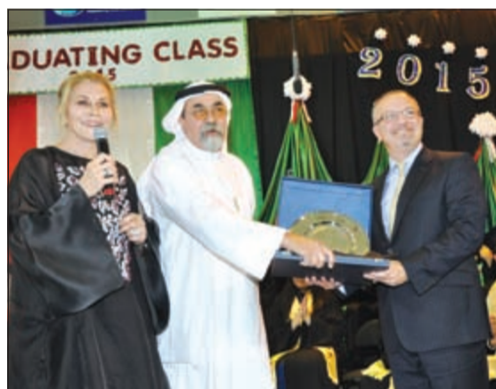
غريبلّي الغريبلّي وسنتال الغريبلّي يكرمان السفير ماثيو لودج