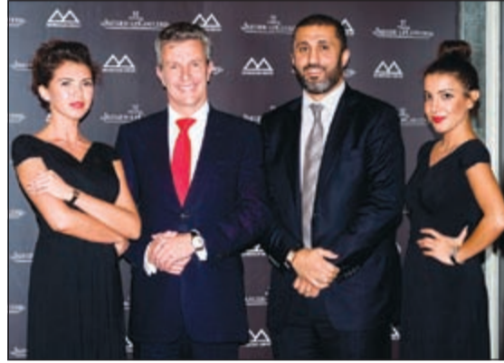
جانب من العرض