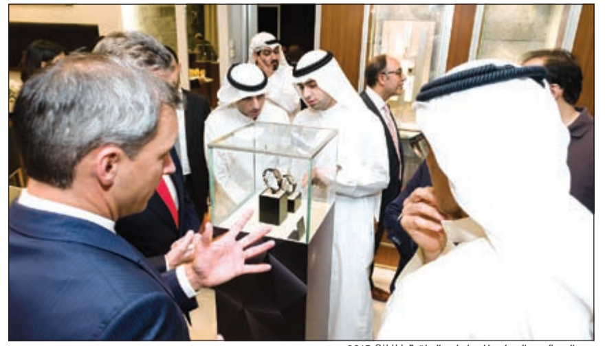
من الصالون الدولي للساعات الراقية SIHH 2015