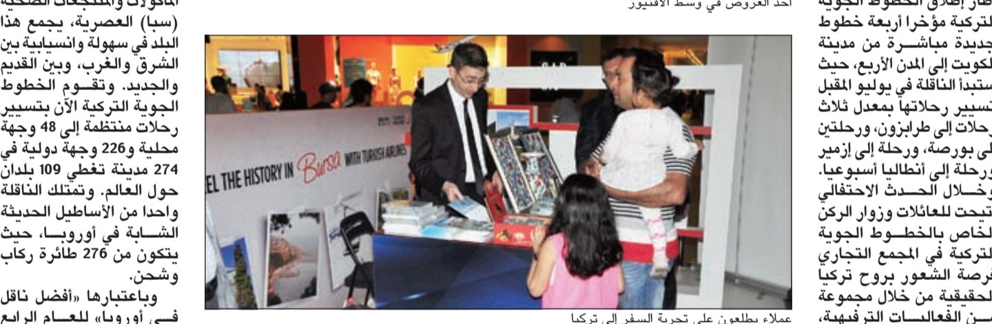
أحد العروض في وسط الأفيوز

تعاونت الخطوط الجوية التركية، التي تعد واحدة من أسرع الناقلات نمواً في العالم، مع المجلس الوطني للثقافة والفنون في الكويت للاحتفال ببناء وتنوع الثقافة التركية، في إطار إطلاق أربع وجهات جديدة من مدينة الكويت، هي طرابزون وبورصة وإزمير وأنطاليا، وذلك خلال جولة ترويجية خاصة أقيمت في مجمع الأفيوز بالكويت. وجاء تنظيم الحدث في إطار إطلاق الخطوط الجوية التركية مؤخراً أربعة خطوط جديدة مباشرة من مدينة الكويت إلى المدن الأربع، حيث سبقت الناقل في يوليو المقبل تسير رحلاتها بمعدل ثلاث رحلات في طرابزون، ورحلتين إلى بورصة، ورحلة إلى إزمير ورحلة إلى أنطاليا أسبوعياً. وخلال الحدث الاحتفالي أتيحت للعائلات وزوار الركن الخاص بالخطوط الجوية التركية في المجمع التجاري فرصة الشعور بروح تركيا الحقيقية من خلال مجموعة من الفعاليات الترفيهية، بما فيها عرض الرقصات الفلكلورية التركية التقليدية والموسيقى التركية والحرف اليدوية. حضر الفعاليات محافظ المدن التركية الأربع، وقامت عارضات أزياء برتديج والملابس التركية بالترحيب