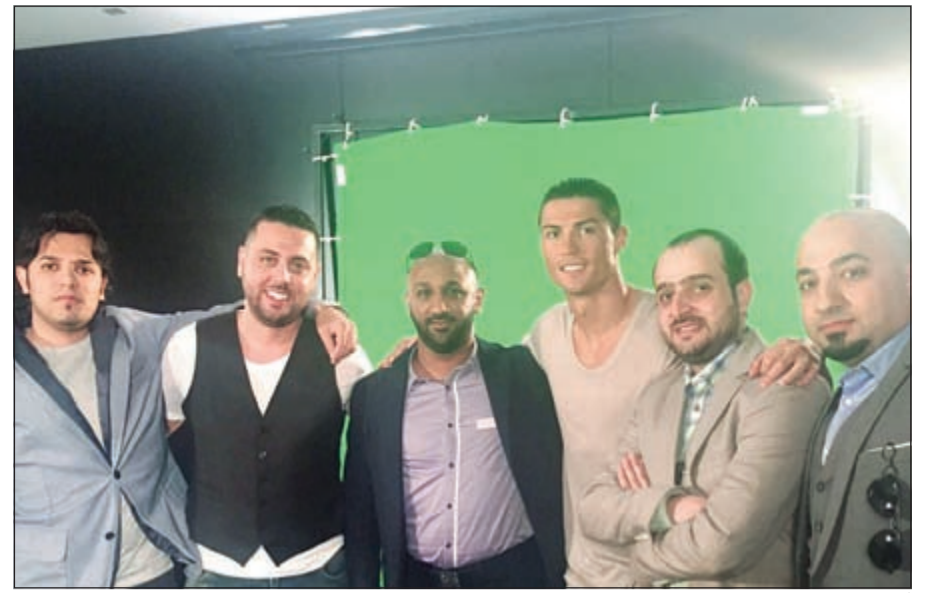
أعضاء مجلس الإدارة مع رونالدو