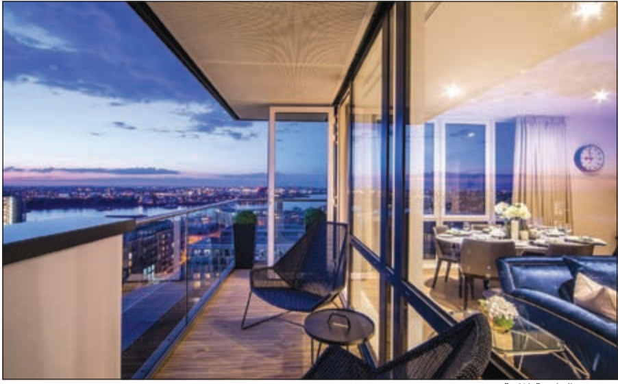
مشروع الواجهة المائية