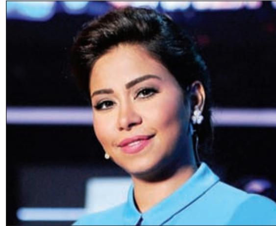
شيرين عبد الوهاب

صعود. وقد تم تصوير العمل بين مصر وبعض الدول الأوروبية، وقد نفي المؤلف تامر حبيب، أن يكون المسلسل هو قصة حياة شيرين عبد الوهاب، مشددا على ان الأحداث ستوضح هذا الاختلاف وأنه لا ينبغي الحكم على المسلسل قبل عرضه.