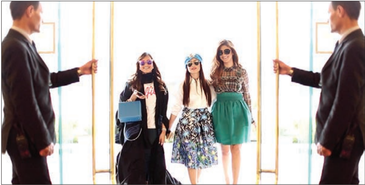
تشكيلات مختارة من أرقى الأزياء

الموسم. ومن أهم المصممين الذين سيزورون الكويت للمشاركة في مهرجان «FABFEST» البرنو مورتي، مصمم الأحذية الفاخرة الذي يشتهر بشغف الإبداع والقدرة على ابتكار مجموعة التي يستوحىها من المرأة. كما أن متجره الكائن في سان تروبيه ومجموعته المعاصرة المنتشرة في كبرى محلات الأزياء الفاخرة حول العالم تضم أجود الأحذية الإيطالية ذات التصاميم المتميزة. وخلال مهرجان «FABFEST» سستمكن الزبائن من تصميم أحذية خاصة بهم وحسب نوقهم من خلال تحديد موعد مسبق مع البرنو ولقائه وجها لوجه.