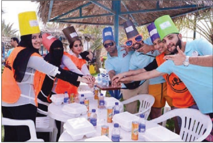
مشاركة من الحضور