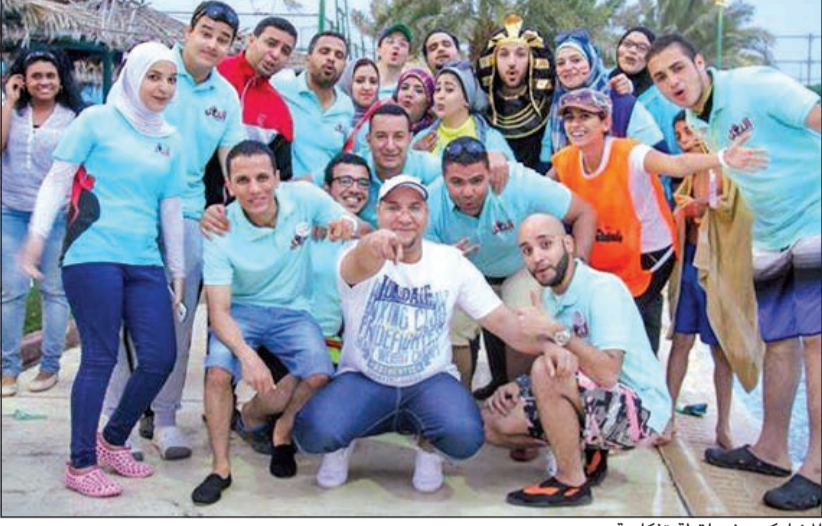
الشاركون في لقطة تذكارية

في الاحتفال باليوم العالمي للبيتم، شكر على ما قدموه ومازالوا يقدمونه من أعمال تطوعية خيرية لا يبعون من ورائها أي منافع شخصية، مجرد أنهم يريدون إرساء العديد من المفاهيم التطوعية والخيرية التي باتت في منأى عن اهتمام الكثيرين. وتأتي الفعالية هذا العام تحت شعار «تعيشي يا ضحكة الكيلاني» إهداء من فريق الرابطة لروح زميلهم هشام الكيلاني الذي وافته المنية قبل موعد الاحتفالية وفاء له.