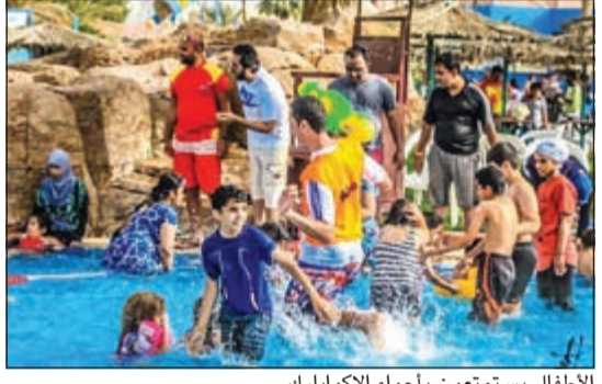
الأطفال يستمتعون بأجواء الأكو بارك