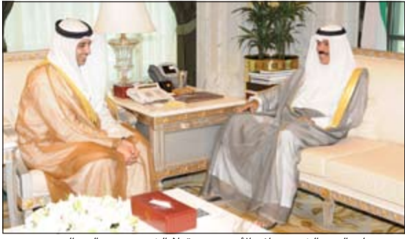
سمو ولي العهد الشيخ نواف الأحمد مستقبلاً الشيخ محمد العبدالله

تلقى سمو ولي العهد الشيخ نواف الأحمد رسالة تهنئة من أخيه رئيس مجلس الأمة مرزوق الغانم، هذا نصها: سمو ولي العهد الشيخ نواف الأحمد حفظه الله.