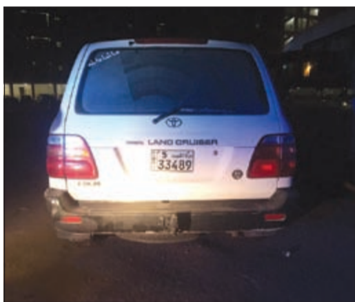
السيارة المسروقة التي ضبطت من قبل أمن الأحمدية

تبين أن المتهم قام بسرقة البقالة والفرار بسيارته التي لم تسعفه بعد أن اصطدم بها ليفر جرياً على الأقدام فتمت مطاردته وضبطه وتسجيل قضية ضده، من جهة أخرى تمكن رجال أمن الأحمدية من ضبط مركبة رباعية الدفع مبلغ عن سرقتها من منطقة جابر العلي ومسجل بشأنها قضية سرقة مركبة، وقال مصدر أمني إن المركبة ضبطت من قبل فرقة المدير العام.