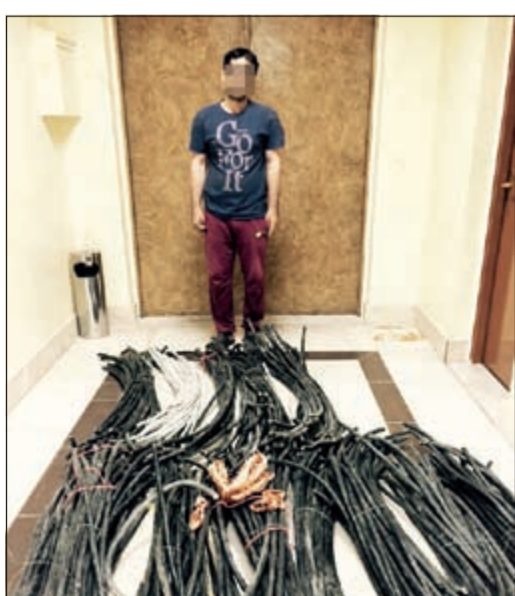
المتهم وامامه المسروقات النحاسية

على مدار السنوات الثلاث الماضية التابعة، وبحسب مصدر أمني فإن اللص الآسيوي واسم المقدم يوسف اليوسف اعترف بأنه يقوم بصهر النحاس