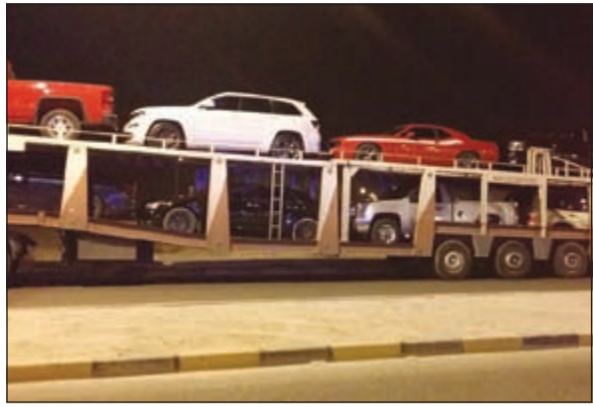
المركبات المخالفة في طريقها لجراج الحجز

على صعيد آخر، شن رجال أمن الأحمدية يوم أمس في منطقة الشاليهات حملة موسعة أسفرت عن ضبط عدد من الباعة الجائلين وتحرير العديد من المخالفات وحجز عدد من المركبات.