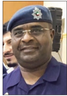
العميد عبدالله سفاخ