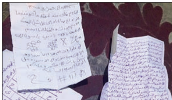
الأحجية والطلاسم التي ضبطت مع الخليجي