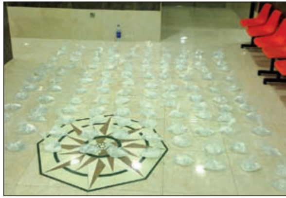
أكياس الخمر المضبوطة