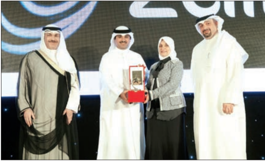
ممثل سمو أمير البلاد وزير الشؤون الاجتماعية والعمل وزير الدولة للشؤون التخطيط والتنمية هند الصباح تقدم درعا تكريمية لممثل زين

جاءت الجائزة هذه المرة لتبرز الدور الكبير الذي تلعبه زين في مجال العلاقات العامة وتفعيل دورها الاجتماعي الذي بات زخرا في جميع القطاعات التي تعنى بتنمية المجتمع بالإضافة لتمييزها في خدمة عملائها الذين يشكلون أكبر عائلة مشتركتين في الكويت. وأشارت الشركة إلى أن جمعية العلاقات العامة الكويتية قد حرصت على استقطاب مجموعة من الخبراء العالميين في مجالات العلاقات العامة وخدمة العملاء الذين قاموا بتقسيم مجموعة من الشركات الرائدة في الكويت استنادا إلى أعلى المعايير العالمية، هذا إلى جانب إقامة