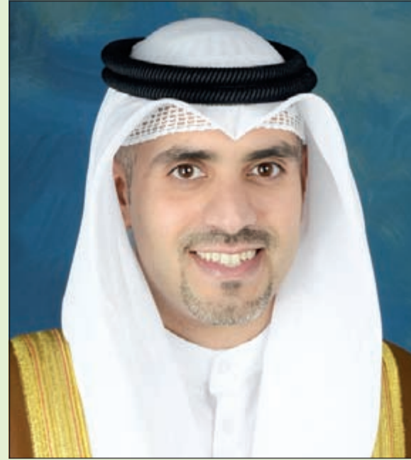
الشيخ مشعل الجابر

كشف المدير العام لهيئة الاستثمار المباشر الشيخ د. مشعل الجابر في تصريح خاص لـ «الأنباء» أن الفترة التي تتطلبها الكويت لحصول الشركات الأجنبية على ترخيص لمزاولة أعمالها بالسوق المحلي لا تتعدى 7 أيام فقط، شريطة استيفاء الشركة المقدمة لأربعة معايير: اولها المساعدة في جلب التكنولوجيا الحديثة للكويت وثانياً ان تتوافر فيها مكونات الإبداع والابتكار وثالثاً توفير فرص عمل للمواطنين الكويتيين ورابعاً ان تمثل استثمار ذات قيمة مضافة للاقتصاد المحلي. وكانت شركة «آي بي ام» افتتحت الاسبوع الماضي شركة جديدة لها في الكويت، لتصبح بذلك اولى الشركات الأجنبية التي تدخل الكويت عقب صدور قانون الاستثمار