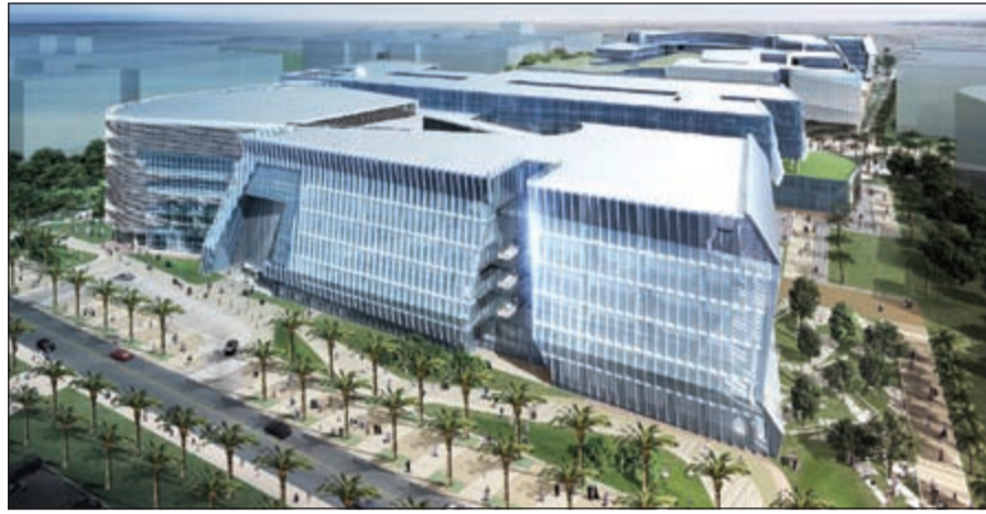
الانتماء بالجانب البيئي

الطبية المتمثل في كلية الطب وكلية الصيدلة وكلية طب الأسنان وكلية الطب المساعد وكلية الطب الوقائي. وتوجد شبكة أنفاق الخدمات الممتدة تحت المدينة وهي الأكبر في الشرق الأوسط بمساحة تبلغ « 7,5 كيلومترات » حيث يبلغ عرض وار تفاع النفق حوالي 8 أمتار مما يسمح بتحرك سيارات النقل داخله، ووجود عدد غير مسبوقة من ملاجئ الطوارئ 29 ملجأ كل ملجأ سعته 300 شخص، بالإضافة إلى الواحة النباتية التي تمتد وسط مباني الكليات لتفصل مباني الطلبة، كما يسخر الحرم الجامعي الجديد أقصى ما يمكن الاستفادة منه من أحدث التقنيات الإلكترونية وفقاً لأعلى المواصفات، وقد تم تجميع الكليات ذات الصلة في ثلاثة قطاعات وهي قطاع الكليات الإنسانية الذي يتمثل في كلية الآداب وكلية التربية وكلية الحقوق وكلية الشريعة والدراسات الإسلامية وكلية العلوم الاجتماعية، وقطاع الكليات العلمية الذي يتمثل في كلية الهندسة والبرترول وكلية العلوم وكلية العمارة وكلية الحياة وكلية علوم وهندسة الحاسوب، وقطاع الكليات