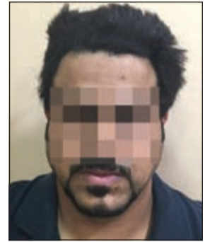
الصلص في مباحث النقرة

أعلنت الإدارة العامة للعلاقات والإعلام الأمني عن تمكن رجال الإدارة العامة للمباحث الجنائية «مكتب مباحث النقرة»، عن ضبط واقد مصري من أرباب السوابق في جرائم السرقة والسلب بالقوة، حيث قام بسرقة مبلغ مالي يقدر بـ