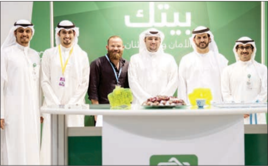
جناح «بيتك» في الملتقى

الذي يعيشه وتوفق دقائق ولحظات مهمة في الحياة العملية والاجتماعية. وبحرص «بيتك» على دعم إبداع المصورين ورعايته لأنشطة وفعاليات مختلفة وتنظيمه مسابقات تصويرية كتلك التي يطلقها في شهر رمضان من كل عام والتي تستقطب آلاف العملاء والمتابعين لصفحات «بيتك» على وسائل التواصل الاجتماعي. ويعتبر «فوتوتوكس» أكبر ملتقى سنوي يلي شغف المهتمين بفن التصوير الفوتوغرافي في الكويت والخليج، حيث يجمع بين المحترفين والهواة بهدف تحقيق التواصل والتعليم عبر مشاركة المصورين قصص نجاحهم ومهاراتهم الفنية وتجاربهم الغنية.