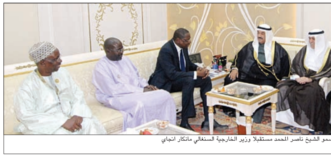
سمو الشيخ ناصر المحمد مستقبلاً وزير الخارجية السنغالي مانكار انجاي