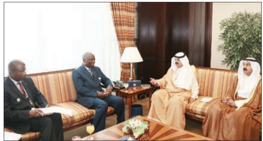
خالد الجارالله خلال لقائه نائب وزير خارجية بوركينا فاسو

التعاون الإقليمي في جمهورية بوركينا فاسو ورئيس وفد بلاده في الدورة الـ 42 للاجتماع الوزاري لدول منظمة التعاون الإسلامي موسي ليجي.