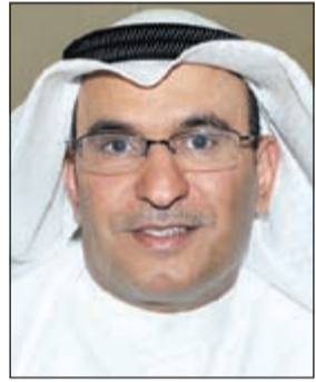
السفير منصور العتيبي

نيويورك - كونا: أكدت الكويت أن الخلافات بين الدول دائمة العضوية في مجلس الأمن واستخدام حق النقض (فيتو) ساهم في تفاهم معاناة المدنيين واستمرار الانتهاكات الجسيمة للقانون الإنساني الدولي وقانون حقوق الإنسان. التي ألقاها المندوب الدائم للأمم المتحدة السفير منصور العتيبي أمام مجلس الأمن في جلسة خاصة بشأن حماية المدنيين في النزاعات المسلحة. وجدد العتيبي باسم الكويت دعم الدور الذي تلعبه الأمم المتحدة في حماية المدنيين أثناء النزاعات المسلحة، لاسيما من خلال بعثات حفظ السلام التي يجب أن تكون ولاياتها واضحة ومهامها محددة، لتساهم في ترسيخ احترام القانون الدولي الإنساني. وقال أن موضوع حماية