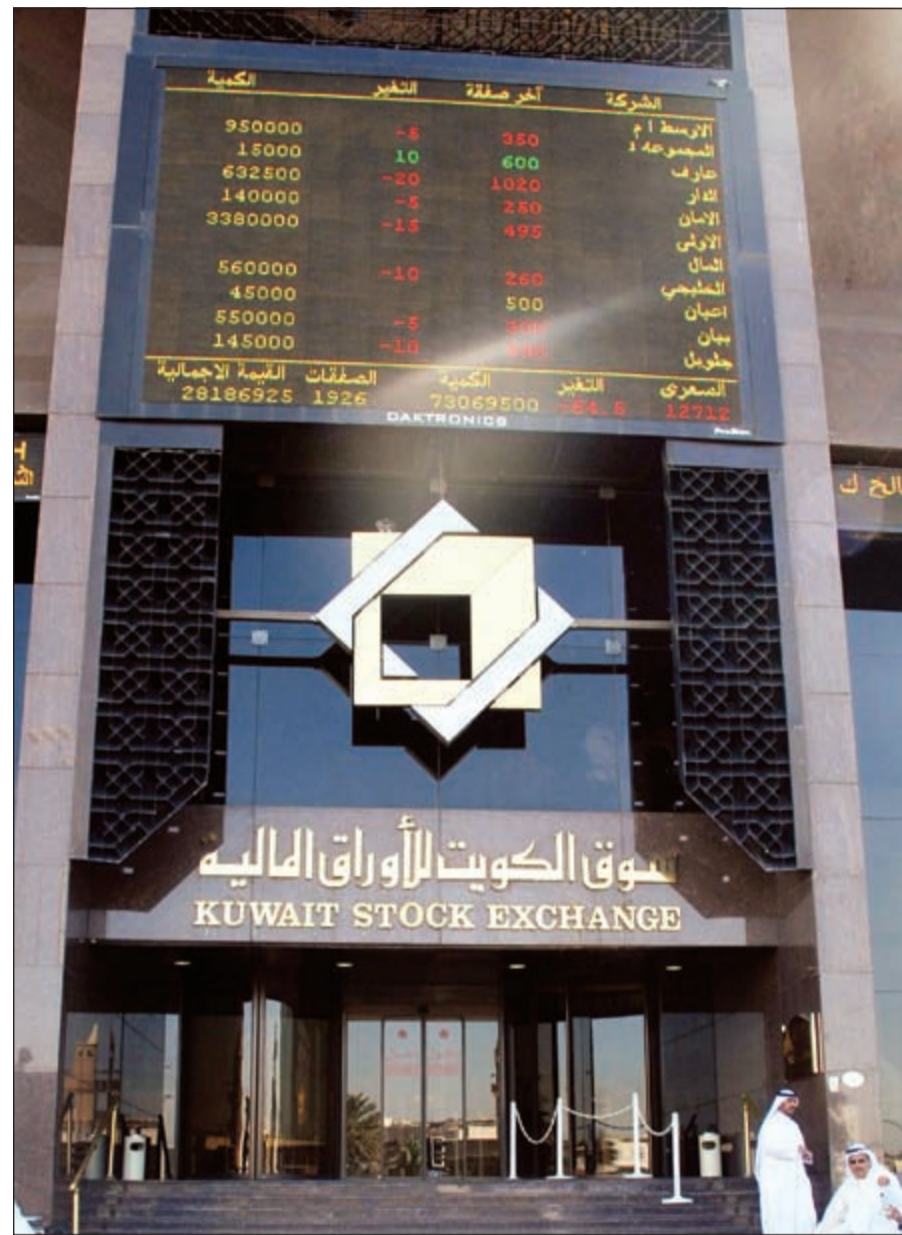
البورصة الكويتية على موعد مع إدراج شركة جديدة في 11 يونيو المقبل (محمد خلوصي)

وعينت شركة ميزان القابضة شركة الوطني للاستثمار (NBK Capital) لمستشاراً للإدراج ومدبراً للاكتساب للطرح الخاص الثانوي بما يعادل نسبة 30٪