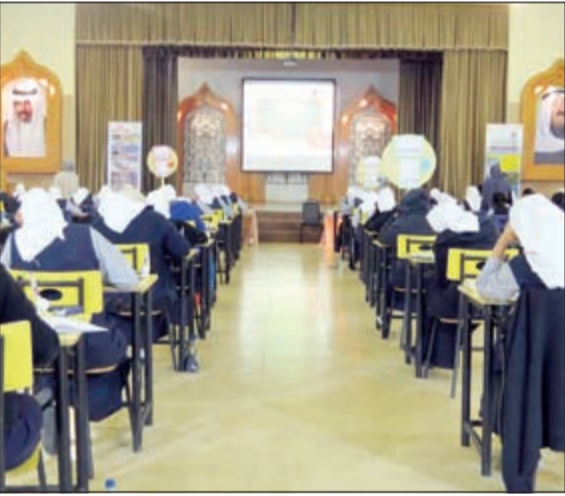
طالبات ث قرطبة

وأوضحت المير أن عدد الطالبات المتقدمات للاختبارات الثانوية في لجان عشرون (العلمي) 71 طالبة و(الأدبي) 36 طالبة، وشدد النجم على ضرورة المذاكرة وإعداد جدول زمني، مشيراً إلى أن الصف الثاني عشر بعد مرحلة مفصلية في حياة الطلبة حيث حرصت ثانوية ناصر عبدالرحمن السعيد على الدعم المستمر لطلبات المرحلة على مدار العام الدراسي بتخصيص لجنة متابعة الطلبة الضعاف وكذلك من خلال التواصل مع أولياء الأمور في حال