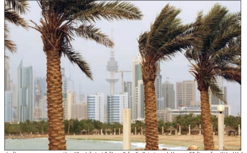
ارتفاع تنافسية مدينة الكويت عالميا بعد ضخ الحكومة السيولة الضخمة في الاسواق