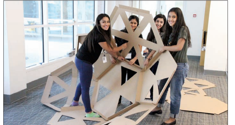
تنفيذ مشروع المشتركين