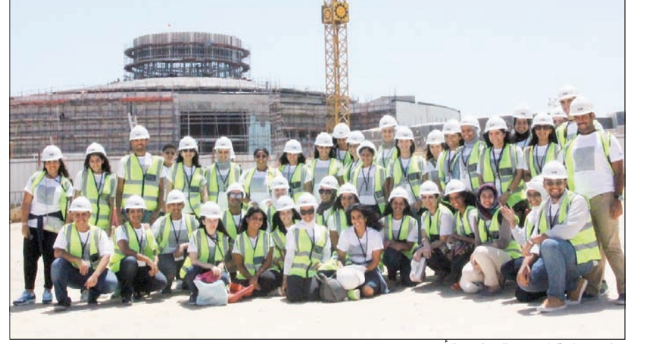
زيارة ميدانية لمشروع النفط في الأحمدية