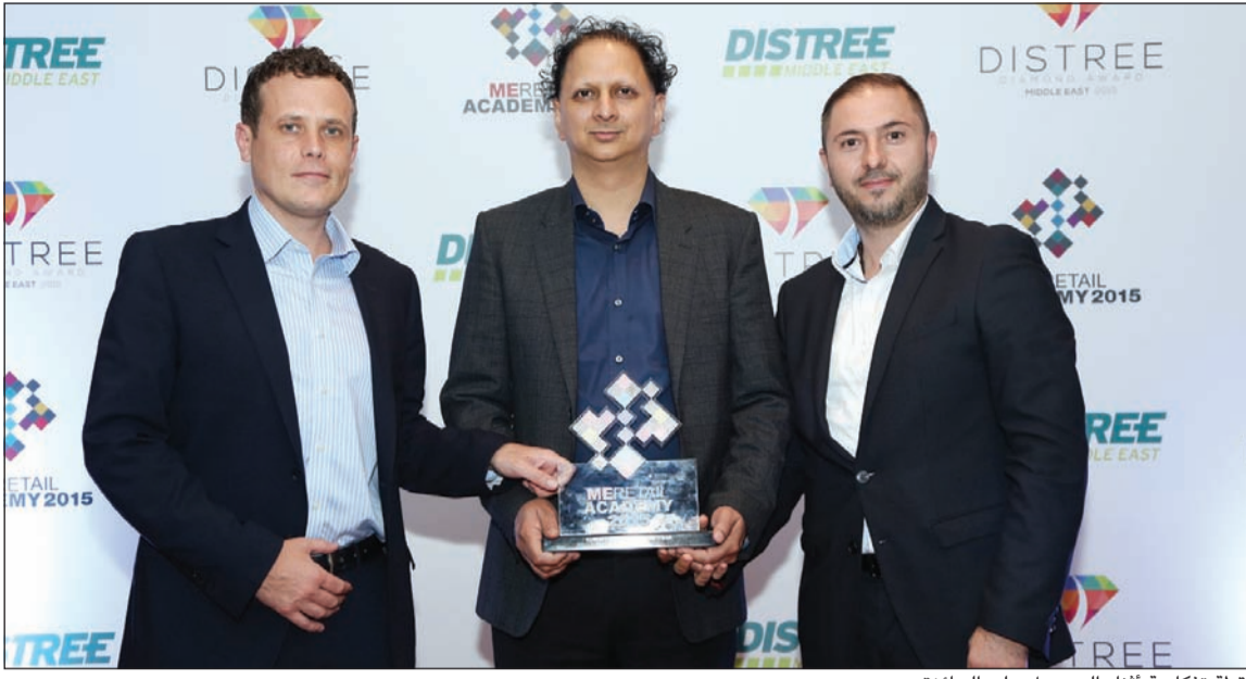
لقطة تذكارية أثناء الحصول على الجائزة

ابتداء من 5 دنانير شهريا فقط مع موافقة فورية. وجميع هذه المزايا والخدمات تؤكد تصدق X-سايت قسمة متاجر الإلكترونيات الضخمة على مستوى الكويت. وتم مؤخرا إطلاق أضخم مهرجان في الكويت بحيث يمكن لعملاء X-سايت الفوز بـ 30 سيارة بـ 30 يوما مع كل مشتريات بقيمة 25 دينارا، وذلك من 20 مايو ولغاية 18 يونيو. وسيتم الإعلان عن أسماء الفائزين على موقعنا xcite.com، وأيضا من خلال مواقع التواصل الاجتماعي الخاصة: (انستغرام: @xcitealghanim)، (تويتر: @xcitealghanim)، (سناب شات: @xcitealghanim)، و (فيسبوك: @xcitebyalghanim) أو بمتابعة الهاشتاغ #30Cars30Days