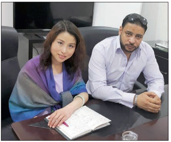
لقطة تذكارية بعد التوقيع