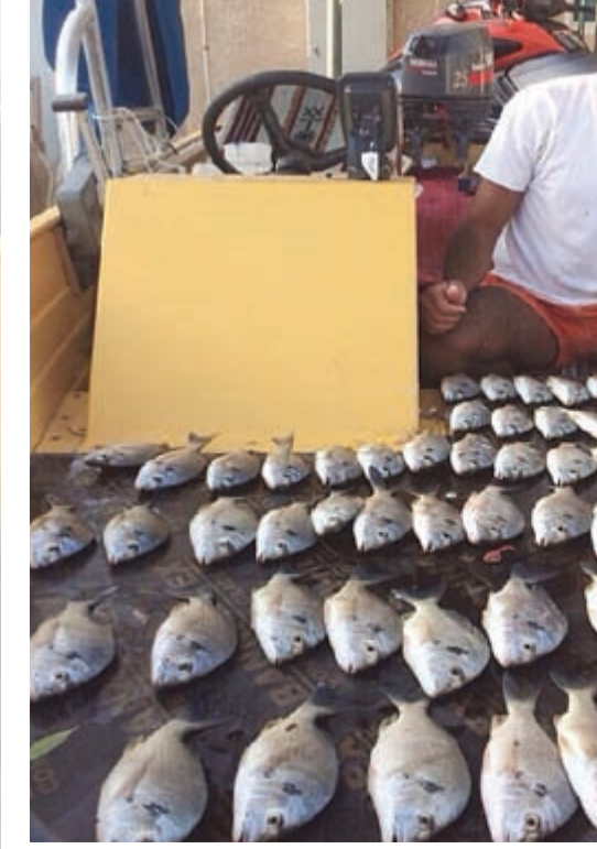
الهامور رغبة الحداقة

ويضيف الغيص: الهامور من الأسماك التي لها مكانة خاصة لدى الكويتيين لما لها من صفات لا توجد في أغلب الأنواع الأخرى، فطعمها شيء خيالي وشكلها يعجز الوصف عنه، وصيدتها فيها «فخر» وأفضل ما به حق صيد الهامور تكون على أول المسجى والوقفه وبالفساد يعني ثلاثة أوقات تقدر تختار منها الوقت اللي يناسبك وطبعاً بالنهار وليس معناه أن ما ينصاف بوقت ثاني، لكن الأوقات التي ذكرتها تعطيك فرصاً أكبر لصيدته وطبعاً البيمة المفضلة عند الهامور هي المحايمة من البيمة أو الموجى أو النقاقة وحجم خيطه يكون من 70 وأنت صاعد ليرن توصل للدرجات، وإذا حبيت تروح تصيد الهامور بالطبعانات أو صوب الشيرات لازم تكون ترديعك علاق بمسافة باع أو أكثر ويعتمد على حسب العمق والمكان، ولا تنس إذا ضرب عليك هامور وادعه على الراحة ولا تستعجل علشان لا يلحف أو يشرم وإذا وصل عندك ارفعه بالجزرة واسدحه بطرادك وعليك بالعافية.