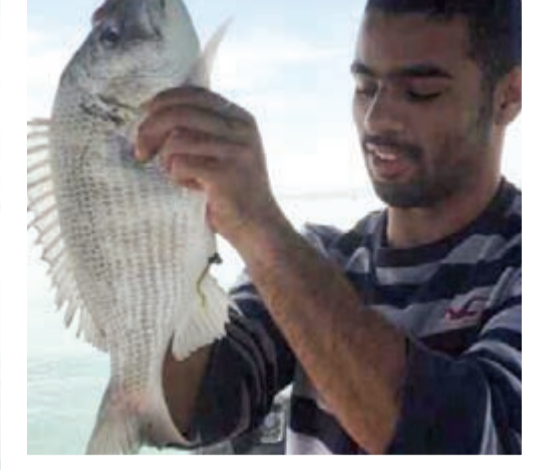
ويقول: الصيد أرزاق يوزعها رب العباد كيف يشاء والخبرة هي مفتاح الوصول لأفضل مواقع الأسماك لأن صاحب الخبرة والمهارة يعرف متى يدخل للبحر وأين يذهب وماذا يريد أن يصطاد ويختار المايه الصح ويختار أيضا الييم المناسب في المكان والوقت الأفضل ولا شك أن مسالة الليل والنهار لهما أصحابهما وكل شخص له رغبة في شيء معين يخلص له ودائما نجد صيد النهار أكثر من الليل والسبب هو أن في هذا الوقت تكون الأسماك متواجدة وترعى، أما الليل فأغلب الأسماك تكون حركتها خفيفة وتواجدها يكون شبه مقطوع، فلماذا أغلب الحداقة يفضلون صيد النهار، وطبعاً يحلو الصيد أكثر شيء عند الكل في فصل الشتاء لأن الجو يكون جميلاً جداً، وخصوصاً إذا كان مغيماً وفيه رششة مطر خفيفة راح يكون في هذا الوقت تحديداً الشعم طاقع وأكثر من هذا الشيء شفو تبي بعد.