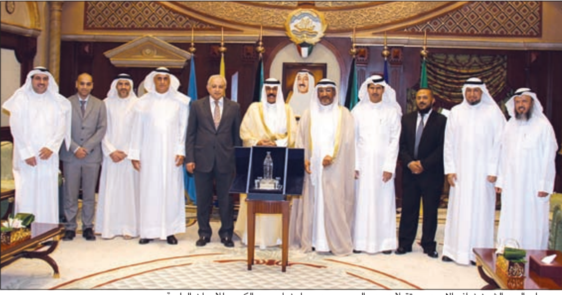
سمو ولي العهد الشيخ نواف الأحمد مستقبلاً د. بدر العيسى ومدير واعضاء معهد الكويت للأبحاث العلمية