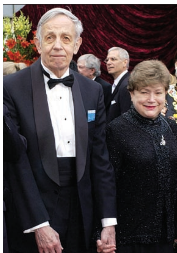
عالم الرياضيات والاقتصاد جون ناش مع زوجته اليسيا حيث قضيا أول من أمس في حادث سير مأساوي

حيث حصل على ماجستير في الرياضيات وكان مشهوراً بذكائه. ● حصل ناش على درجة الدكتوراه عام 1950 من جامعة Princeton في نيوجرسي وشهد له أساتذته بعبقريته. ● انضم ناش فيما بعد إلى معهد ماساتشوستس في كامبردج من 1951 إلى 1959، وجاءت استقالته بسبب إصابته بنبوءات نتيجة مرض عقلي حيث أصيب بداء الفصام. ● ارتبط ناش بعد فترة علاج قضاه في مشافي الأمراض العقلية بشكل غير رسمي مع جامعة Princeton، وسمي ناش بـ «شبح القاعة الرائعة» التي دأب يكتب فيها شفراته السرية. ● تم إنتاج فيلم عن قصة حياته ومعاناته مع المرض بعنوان Beautiful Mind أو العقل الجميل 2001 وقام بدور ناش الممثل العالمي راسل كرو حيث حصد الفيلم 4 جوائز أوسكار.