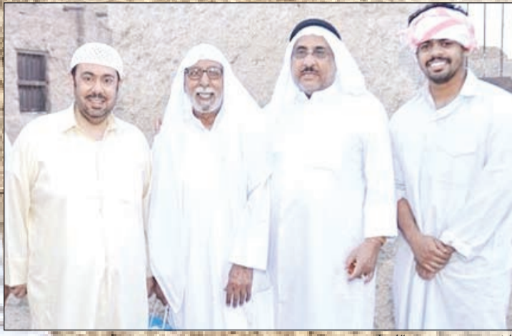
الشعبي مع نجوم «الليوان»