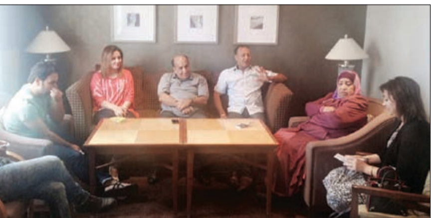
فريق مسرحية «أليس في بلاد العجائب» أثناء المؤتمر

معها وبنام عندهما تغرب وتدوهم للنظام في الرياضة والغناء والعمل والانسجام والتعاون على الخير والحب والسلام. لكن النمر «فرکش» الكسلان يستيقظ في أحد الأيام فيجد نفسه جوعان وجسمه ينحف و«يكش»، لياخذنا المؤلف المخرج في رحلة مأساة «فرکش» ومعاناته مع المرض بعدما فقد وزنه وتغير شكله وتحول إلى حمار وحشي وتم إهانته من الحمبر بعد أن كان معززا وسط اصداقائه، ويتمكن من الهرب لكن يزداد جوعه ومرضه وينحف أكثر ليصبح كلبا ثم قظا ثم فارا ثم يتحول إلى حشرة غير معلومة، لتتلقفه ملكة النحل وتعالجه ليعود إلى حالته الأولى نمرًا بالتدريج بعدما يتعلم النظام والعلم والمعرفة وقيمة العمل وأهميته في حياته، ليعود إلى اصداقائه الذين كانوا يبحثون عنه ولم يتروكوه. وفي العرض تتداخل العوالم وتتعايش مع بعضها، فنحن أمام ممثلين بشر وعرائس دمي، وهذا التداخل بين العالم الواقعي الطبيعي والعالم السحري الخيالي يخلق أجواء جمالية وممتعة بصرية، فالحيوانات شخصيات حيّة تنطق وتفكر وتتفاعل مع هذا الفضاء المسرحي المسكون بالألوان الزاهية المشرقة على يمين ويسار خشبة المسرح، والسرير الذي يرقد عليه «فرکش» لتكشف الطبيعة عليه كأنه جاء من عالم آخر، سرير يتجاوز الواقعية إلى عوالم من «الفتازيا» مرصع