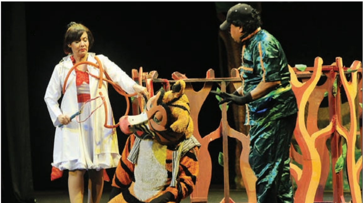
مشهد من مسرحية «فرکش لما يكش»