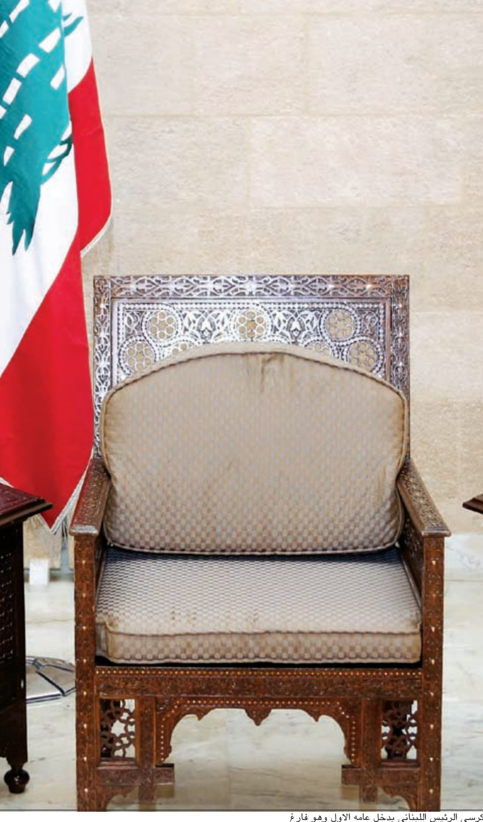
كرسي الرئيس اللبناني يدخل عامه الاول وهو فارغ

واضاف قائلاً: الا يكون ظهور هذا الرأي الشعبي الآخر، هو مصدر قلق الحزب؟ بدوره، وزير الداخلية نهاد المشنوق رد على دعوة نائب الامين العام لحزب الله دخول عرسال بالقول ان تحرير عرسال لا يتم من خلال هجوم مذهبي، وكان الشيخ نجيم قاسم يريد تدمير عرسال لا تحريرها. وراي المشنوق ان مواقف قاسم وتصريحات السيد نضر الله لا يمكن الا ان تؤثر على اجواء الحوار الجاري بين تيار المستقبل وحزب الله.