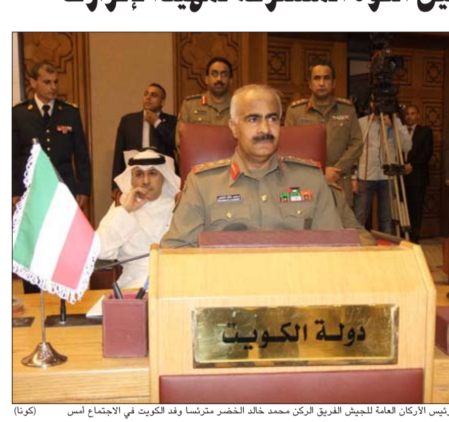
رئيس الأركان العامة للجيش الفريق الركن محمد خالد الخضرمترئسا وفد الكويت في الاجتماع امس

مدير - وكالات: صوت الناخبون الإسبان امس في الانتخابات المحلية والإقليمية التي تأتي في واحد من أكثر المشاهد السياسية تعقيدا، لتشكل امتحاناً صعباً للحزبين الرئيسيين في البلاد. كما صوت الإسبان امس لانتخاب ممثلي مجلس مدينتي «سبتة» و«مليلية» التابعتين للناتج الإسباني المحيط الأطلسي و«إيبيزا» و«مايوركا» و«مينوركا» في البحر المتوسط، فيما من المقرر ان يتم تشكيل جميع المجالس المحلية بحلول 13 يونيو المقبل.