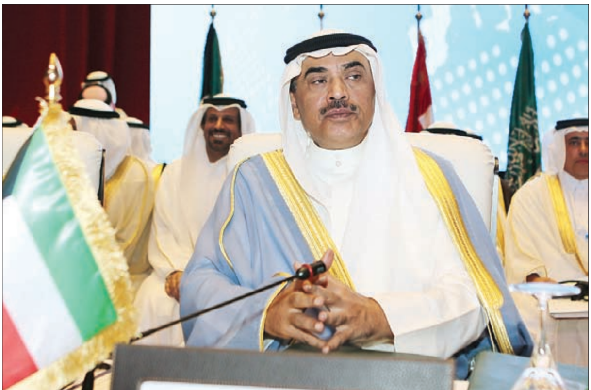
النائب الأول لرئيس مجلس الوزراء وزير الخارجية الشيخ صباح الخالد خلال ترؤسه وفد الكويت في الاجتماع الوزاري الخليجي - الأوروبي الرابع والعشرين بالدوحة امس

وفي الشأن الفلسطيني، أشارت موغيريني إلى أن الاجتماع يهدف لتنسيق التعاون والجهود لإيجاد حل ومخرج لعملية إعادة الحوار في القضية الفلسطينية وتطبيق حل الدولتين من منطلق المبادرة العربية