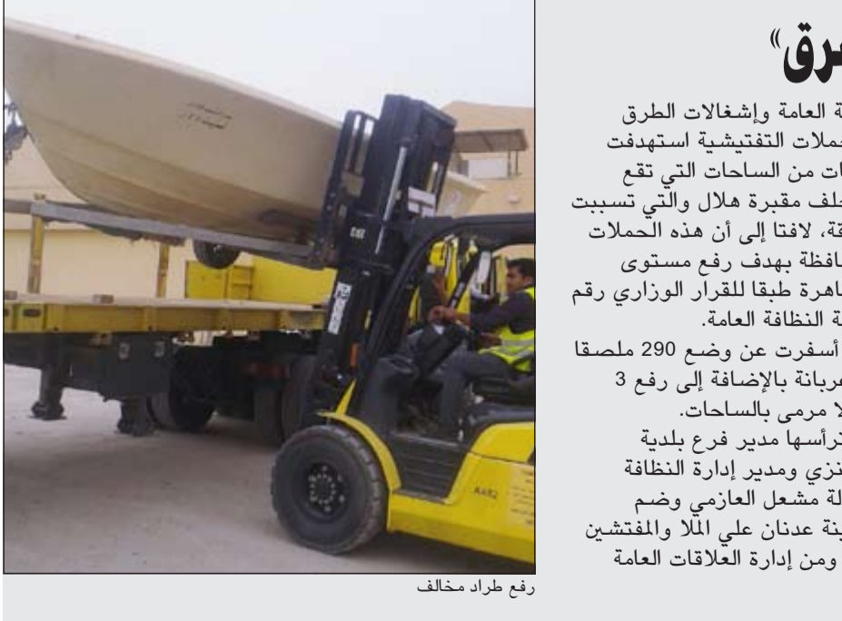
رفع طراد مخالف