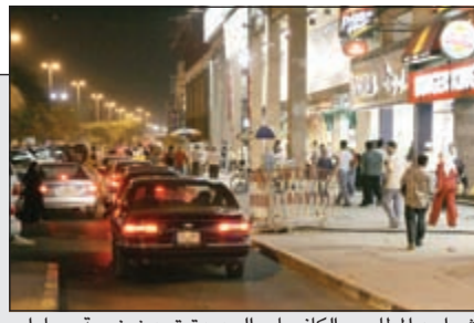
شوارع المطاعم والكافيهات الجديدة تحت زحمة سيارات لعدم وجود مواقف تقابل الطلب المتزايد على هذه الشوارع

شوارع المطاعم والكافيهات.. موضة شبابية تنعش العقار 27